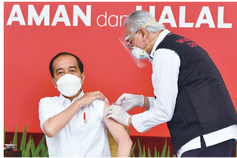
昨日,在印度尼西亚雅加达总统府,印度尼西亚总统佐科接种新冠疫苗。印度尼西亚总统佐科13日上午在雅加达总统府接种了中国科兴公司的克尔来福新冠疫苗,他是印尼国内接种新冠疫苗第一人。

依据美国宪法,众议院负责提出弹劾案,参议院负责弹劾案审理。如三分之二国会参议员支持弹劾,特朗普将被定罪。