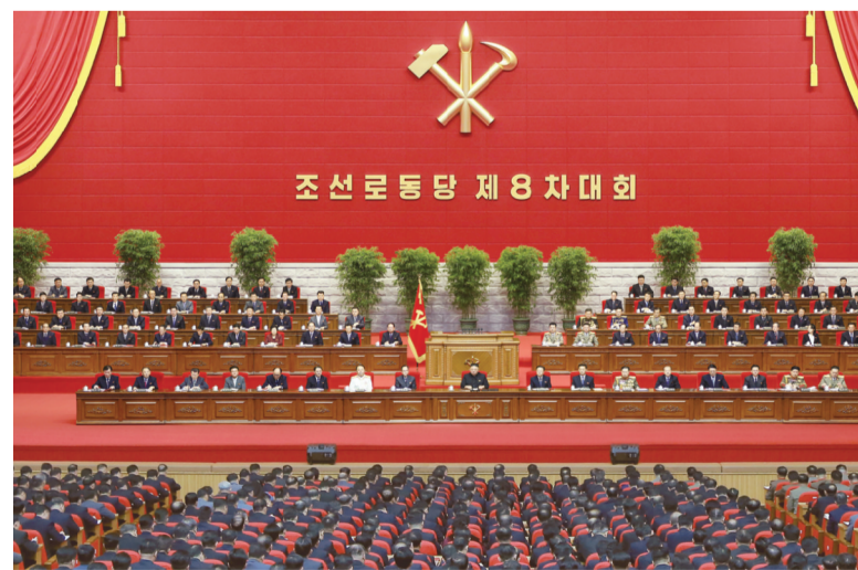
这张朝中社1月13日提供的图片显示的是朝鲜劳动党第八次代表大会12日会议的现场。

据朝中社13日报道,朝鲜劳动党第八次代表大会于12日在平壤闭幕,朝鲜劳动党总书记金正恩做了有关党的第八次代表大会的纲领性总结并致闭幕词,强调要加强团结和自力更生。