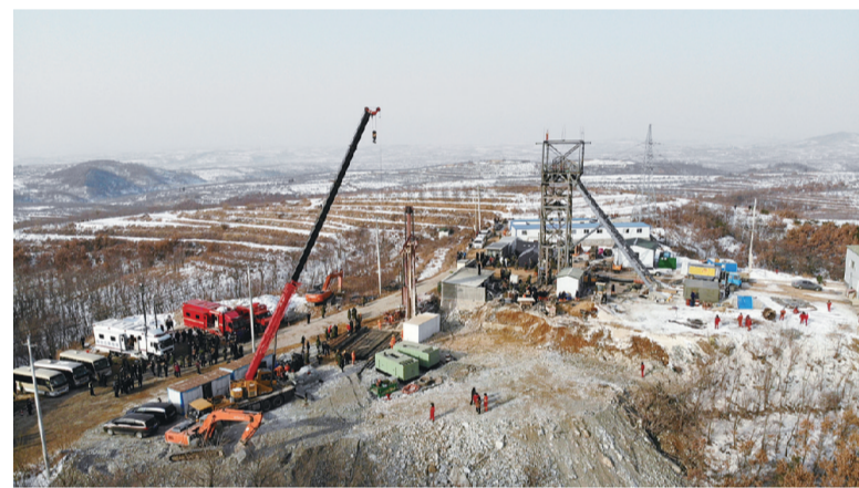
这是1月13日拍摄的山东烟台栖霞市笏山金矿爆炸事故救援现场(无人机照片)。

目前,山东烟台栖霞市笏山金矿事故救援工作仍在紧张进行。1月10日14时,山东五彩龙投资有限公司笏山金矿距井口240米处的“一中段”发生爆炸,导致22人被困井下。