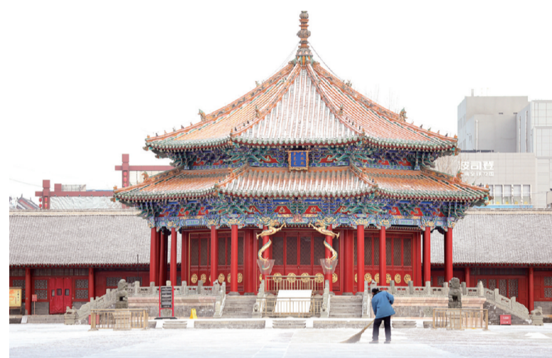
昨日,一名工作人员在沈阳故宫大政殿前扫雪。当日,沈阳市迎来一场降雪,沈阳故宫在白雪的映衬下古朴宁静,分外美丽。