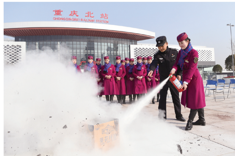
昨日,重庆客运段乘务人员和重庆铁路公安处民警进行应急技能模拟演练。当日,为备战春运,中国铁路成都局集团有限公司重庆客运段联合重庆铁路公安处在重庆北站南广场开展服务礼仪培训、应急技能模拟演练等活动。