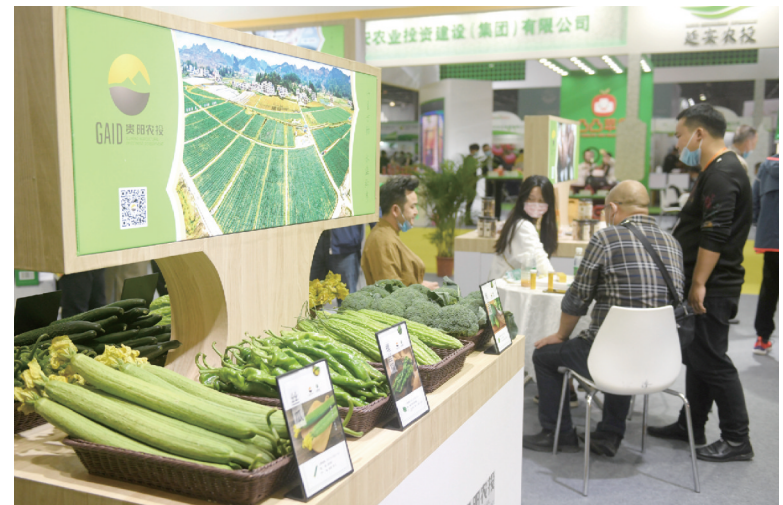
昨日,客商在展馆内参观选购蔬菜。当日,第三届广州世界农业博览会在广州保利世贸博览馆开幕。据了解,本届博览会吸引众多国内外企业前来参展,展品包括优质农产品、果蔬种植与加工技术、农业机械与农资及智慧农业技术等。