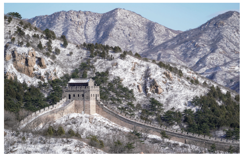
这是11月8日拍摄的北京八达岭长城。11月6日至7日,北京迎来降雪天气。雪后的八达岭长城格外壮观,如同画卷。