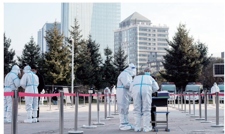
昨日,在西宁市中心广场核酸采样点,工作人员进行核酸采样准备。11月8日9时开始,青海省西宁市主城区开展第二轮全员核酸检测。据了解,西宁市主城区11月6日至7日进行第一轮全员核酸检测,共采样144.8万人份,结果均为阴性。