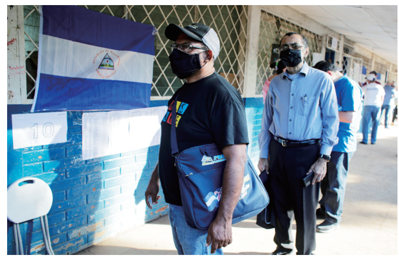
11月7日,在尼加拉瓜马那瓜,当地民众在一处投票站外准备投票。尼加拉瓜7日举行总统和议会选举。