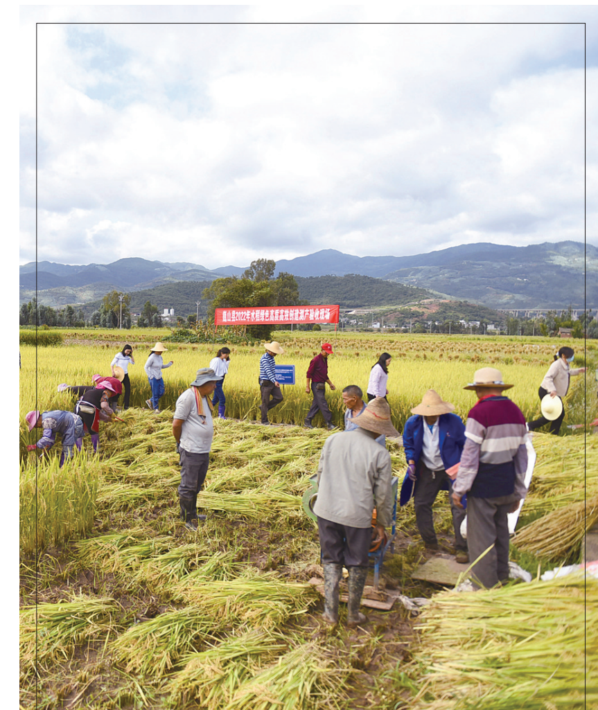
巍山县农业农村局农技站技术人员在庙街镇盟石村田间开展水稻绿色高效创建项目测产验收。(摄于9月27日) 金秋时节,巍山县8.5万亩水稻成熟收割,当地农业农村部门组织农技人员深入水稻绿色高效创建项目示范区开展水稻测产验收,助力农业增效、粮食增产、农民增收。 [特约记者 张树禄 通讯员 官崇主 摄影报道]

完善管网体系,引气进小区工作步入正轨。在完善管网体系、强化气源保障的同时,按照应改尽改、能改尽改的原则,结合老旧小区改造,整体推进“瓶改管”工程,着力提升用气规模,推动全长17千米的祥云天然气综合利用工程支管道项目建设。加快推进天然气支管道、城市燃气管网、门站、加气站等利用设施建设,祥云天然气综合利用工程支管道项目于2019年10月实现通气投产以来,2020年用气量达308万立方米,2021年达604万立方米,预计今年可实现750万立方米天然气供气量的目标任务。