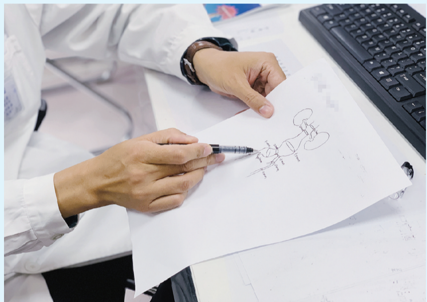
10月4日，血管外科的医生为患者及其家属画图讲解治疗方案。