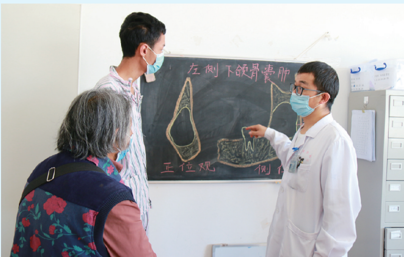
10月7日，口腔颌面外科的医生在向患者及其家属讲解治疗方案。

据了解，对于一些比较复杂的病情和治疗方案，如果只是靠医生口述，医患之间很难沟通，不仅不利于患者对病情的认知，还会影响后期的治疗效果。于是，大理大学第一附属医院的医生们便用绘图的方式来与患者及其家属沟通，这种形象直观的方式能够让患者及其家属对疾病和治疗方案有更加深刻的认识和了解，同时也在一定程度上缓解患者及其家属的精神压力和紧张，增进医患之间的信任、配合和理解，实现医患同心，共战病魔。