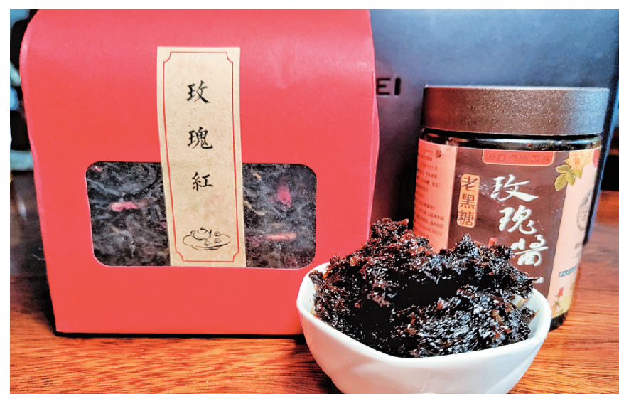
玫瑰红茶和玫瑰糖。