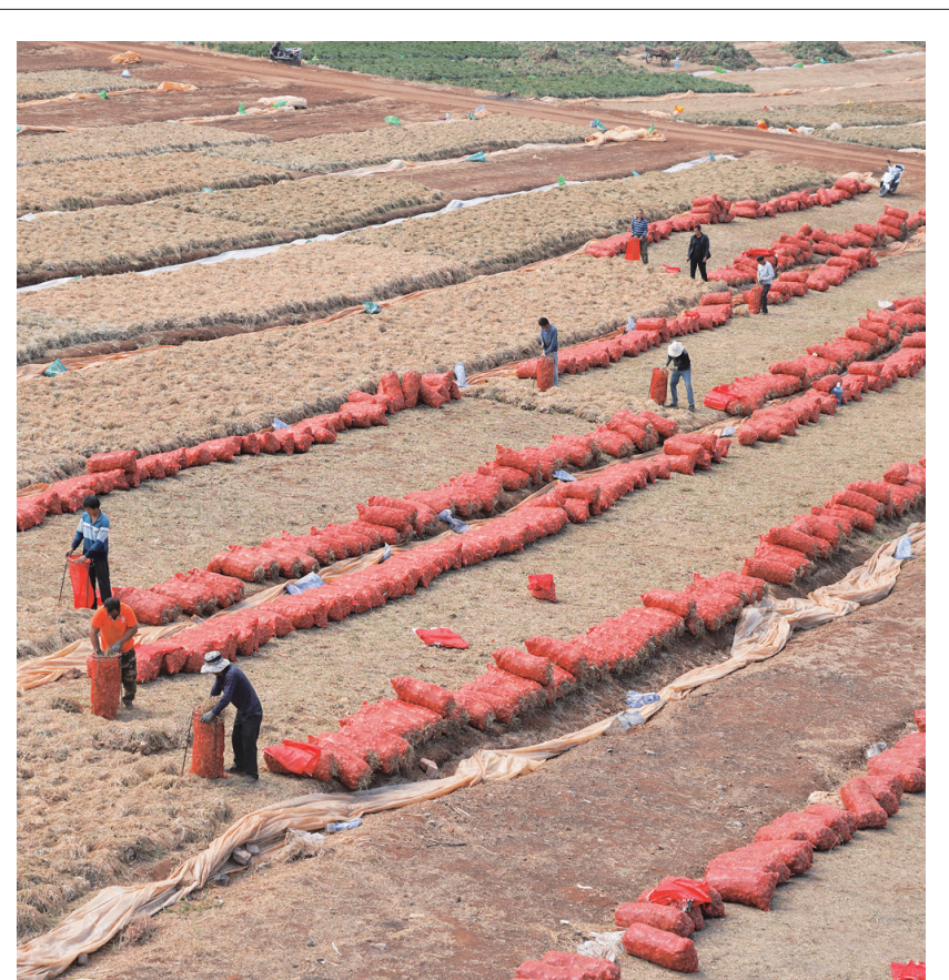
宾川县金牛镇纳溪社区佛都新村群众将晒干的小葱打包。(摄于4月25日)近年来,宾川县在积极推进高原特色水果产业转型提质的同时,引导群众因地制宜发展特色种植,增加群众收入。2022年,全县种植小葱3.62万亩,产量9.75万吨,产值达4.68亿元。