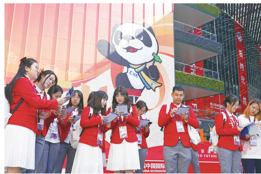
11月1日,志愿者在熟悉场馆结构和地图信息。近日,5700余名第六届中国国际进口博览会志愿者走进国家会展中心(上海),分批开展实地培训,实地了解和熟悉场馆结构、点位路线和岗位职责,以更好地在会期开展志愿服务。【新华社记者 刘颖 摄】

境治理体系,实现生态环境规划、规则、体制衔接。但彦铮常委代表农工党中央发言建议,突破优化风光水储互补开发技术,建立涵盖开发、规划设计、运行调度、智慧管理全周期的技术体系,促进清洁能源消纳。何志敏常委代表民进中央发言建议,统筹推进新时代治沙工作,强化规划衔接和部门协同,推动相关法律修订,完善产业化治沙机制。曹卫星常委代表民盟中央发言提出,协同推进长江流域生态环境保护,加强重点生态保护区治理修复,创新上下游生态补偿机制。刘同德常委提出,保护好青藏高原生态,建设