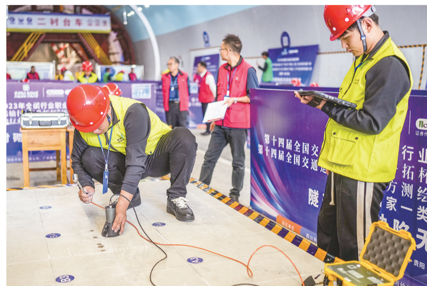
11月1日,选手参加隧道衬砌缺陷无损检测项目比赛。当日,全国交通运输行业桥隧职业技能大赛总决赛在贵阳开赛,来自国内的85支队伍214名选手围绕钢筋骨架加工、隧道衬砌缺陷无损检测、施工放样等赛项展开角逐。比赛为期4天,设置职工组和学生组两个组别。