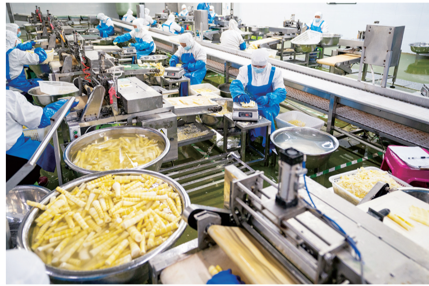
10月31日,昭通市大关县一家竹笋生产企业的员工在流水线上称竹笋。近年来,云南省昭通市大关县将竹笋产业作为“一县一业”产业大力发展,全县竹林总面积115.83万亩,2022年实现竹笋年产量3.5万吨、竹材年产量2.5亿根,竹产业综合产值14.8亿元。一批竹竹家庭农场、集体经济组织、专业合作社等发展壮大,助力乡村振兴“节节高”。