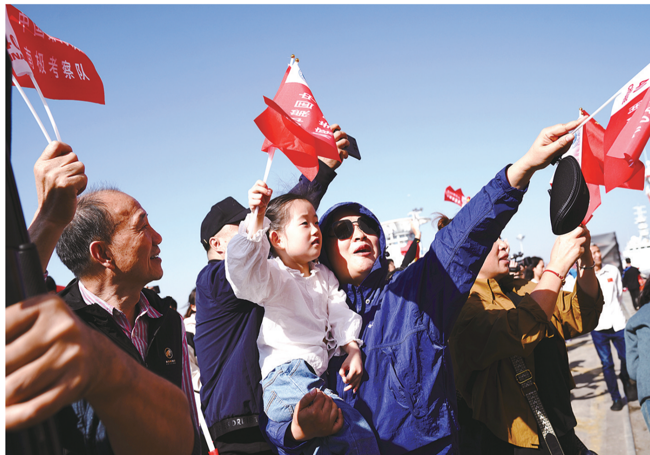
11月1日,在中国极地考察国内基地码头,人们欢送中国第40次南极科学考察队出征。当日,由自然资源部组织的中国第40次南极科学考察队出征,踏上为期5个多月的科考征程。我国南极科考任务首次由3船保障,“雪龙”号和“雪龙2”号极地科学考察破冰船从上海出发,“天惠”轮货船从江苏张家港出发,本次考察将建设罗斯海新站,是我国在南极的第5个科考站。