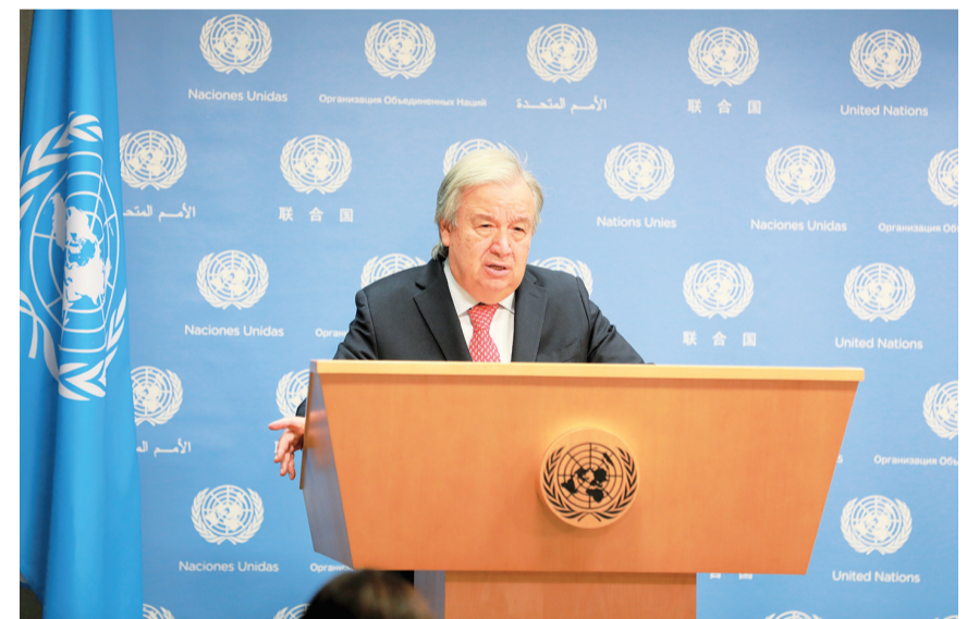
11月6日,联合国秘书长古特雷斯在位于纽约的联合国总部举行的记者会上讲话。联合国秘书长古特雷斯6日说,巴勒斯坦加沙地带的灾难令人道主义停火刻不容缓。古特雷斯在记者会上表示,加沙地带的噩梦不仅是一场人道主义危机,更是一场人性危机。他强调,必须把保护平民放在首位,冲突的任何一方都不应凌驾于国际人道法之上。

国等传统市场进口增长。前10个月,我国对欧盟、美国和日本进出口分别下降1.6%、下降7.6%和下降6.5%。其中,自欧盟和美国进口分别增长5.1%和0.2%。与此同时,我国贸易市场多元化趋势日益明显。前10个月,我国对共建“一带一路”国家合计进出口15.96万亿元,同比增长3.2%,占我国外贸规模的比重为46.5%。其中,对第一大贸易伙伴东盟进出口增长0.9%,对中东欧国家进出口增长2.7%,对中亚五国进出口增长34.8%。