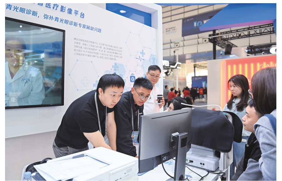
11月7日,观众在腾讯展台了解“宽影”数智医疗影像平台的应用。当日,2023年世界互联网大会“互联网之光”博览会在浙江乌镇开幕。本次博览会以“线下实景+线上云展”相结合,线下设置发展理念区、人工智能、数字新基建、数字技术、未来智造、数字乡村、网络安全等主题展区,以及境外展区、双创展区、未来生活数字体验区等特色展区。