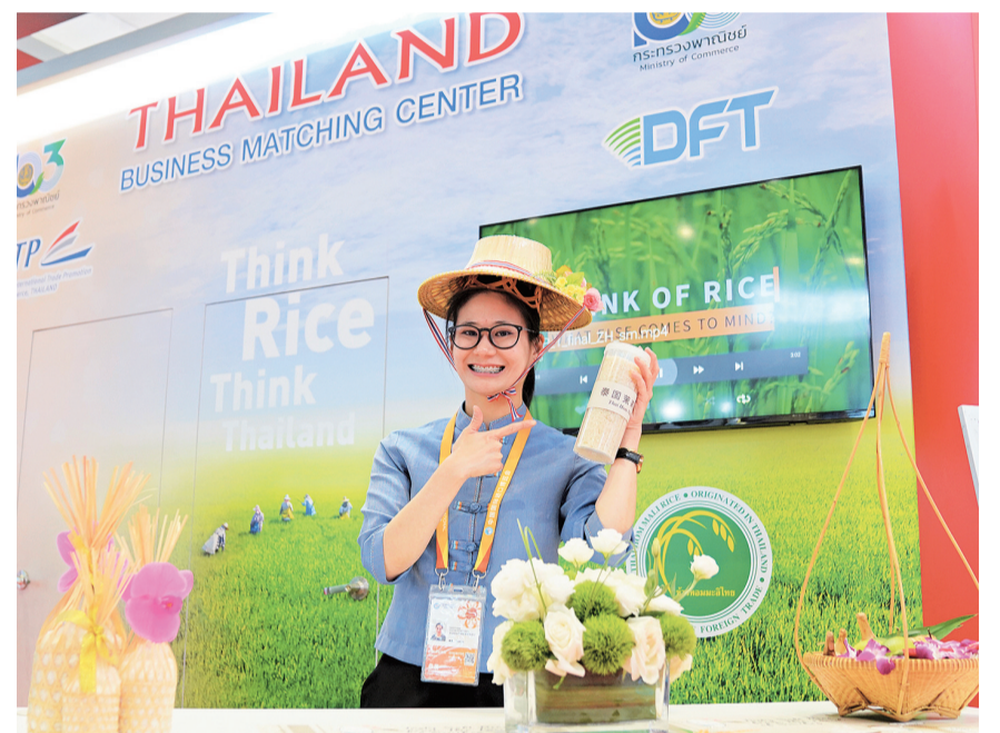
11月7日,展商在第六届进博会国家展泰国展台展示泰国香米。一年一度在上海举行的中国国际进口博览会,成为越来越多“一带一路”共建国家展商的机遇和平台。

根据有关工作安排,在完成省级政府考核巡查后,还将陆续对39个国务院安委会成员单位开展安全生产工作考核。