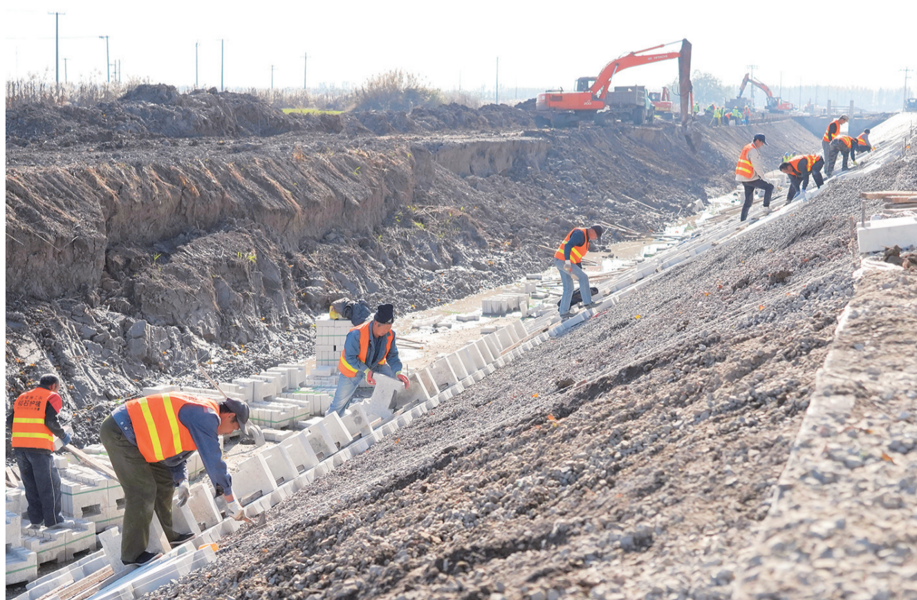
11月7日,工人在唐山市丰南区王兰庄镇彭家庄村灌溉水渠护坡加固工地施工。近日,河北省唐山市丰南区抢抓河流、灌溉枯水期,进行河道疏浚、堤坝加固、河堤修建、灌溉维护等水利设施建设工作,通过兴修和完善水利基础设施,为农业生产和防汛抗旱提供保障。

面向东盟、非洲、拉美等建设了9个跨国技术转移中心,累计举办技术交流对接活动300余场,促进千余项合作项目落地。“一带一路”倡议由中国提出,但是属于全球。”世界工程组织联合会主席穆斯塔法·申胡在致辞中表示,“一带一路”铺就了一条通向共同繁荣的幸福路,在许多领域促成了全方位的互联互通,为世界繁荣发展注入了积极的正能量。