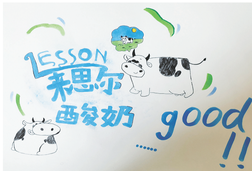
下关三小 六(3)班 杨涵