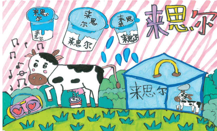
下关八小 91班 李晓睿