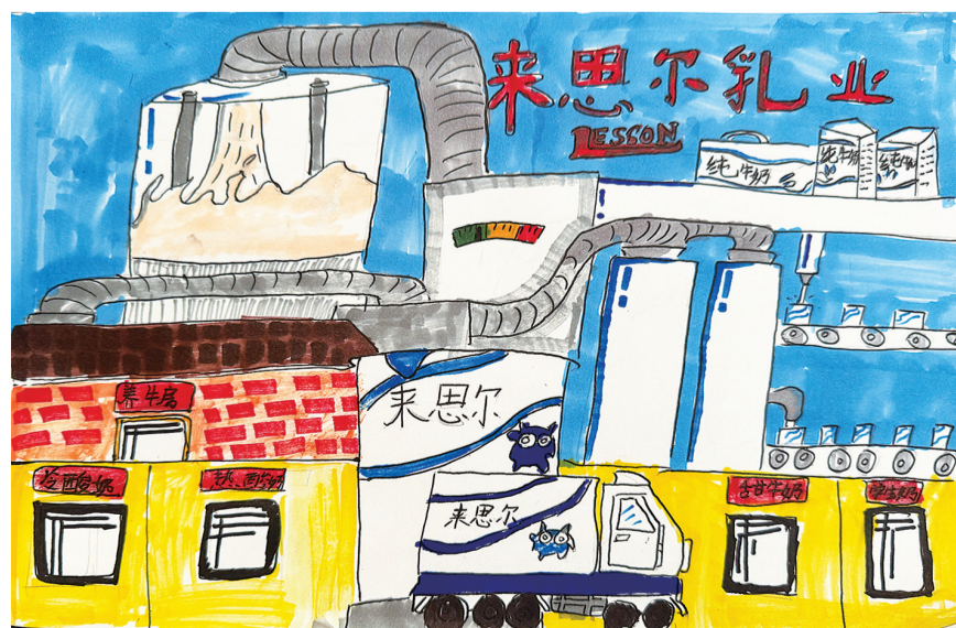
下关四小 259班 殷悦