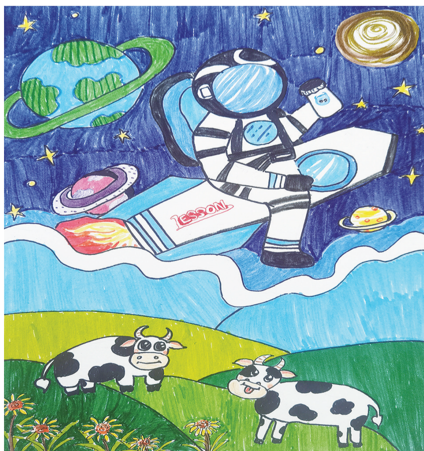
下关一小 184班 安紫轩