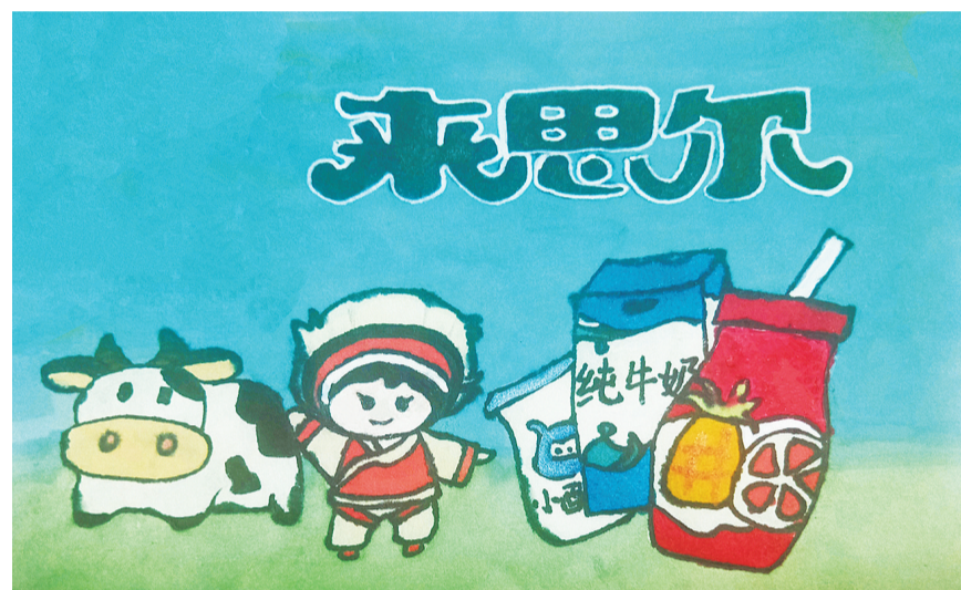
下关八小 68班 程晓