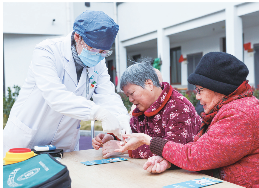
12月26日,巡诊医生在绍兴市越城区塔山街道社区卫生服务中心给老人进行血糖监测。为缓解患病、失能、半失能老年人的医疗和护理问题,从2023年开始,浙江省绍兴市越城区卫生健康局逐步推进医养结合的家庭病床服务,签约家庭病床床数350多张。服务通过家庭医生团队上门的方式为家庭病床老人开展老年护理、慢病管理、康复护理、中医针灸等个性化服务,同时为辖区养老机构内的老人提供日常监测、健康科普、中医康复、双向转诊等医疗保障,使养老有“医”靠,让老人更放心地享受幸福晚年。