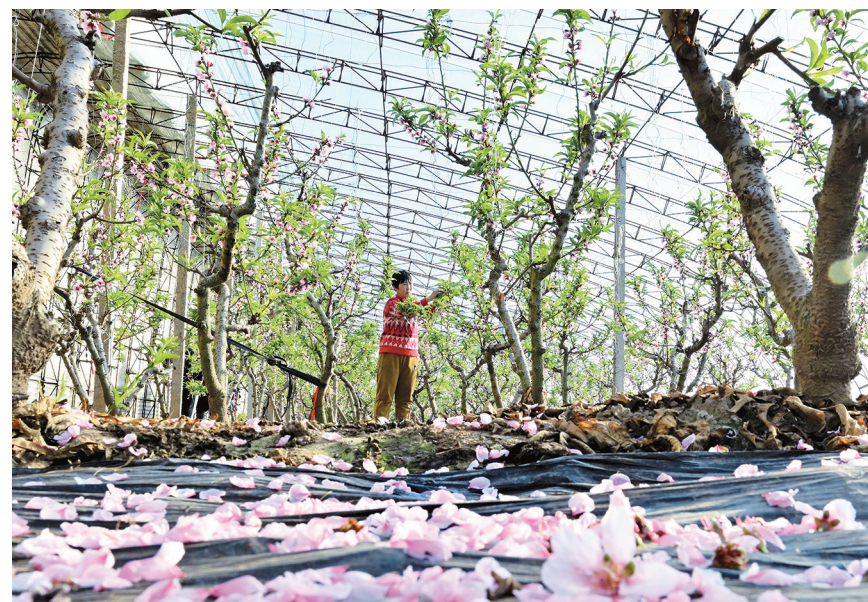
12月26日,河北省乐亭县新寨镇的农民为大棚桃树疏花。近日,河北省乐亭县的大棚桃进入盛花期,农民们抢抓农时进行疏花、授粉,一派繁忙景象。近年来,乐亭县引导农民发展大棚桃种植,促进农民增收,助力乡村振兴。据介绍,目前该县大棚桃种植面积达2.7万亩,年产鲜桃超5万吨。