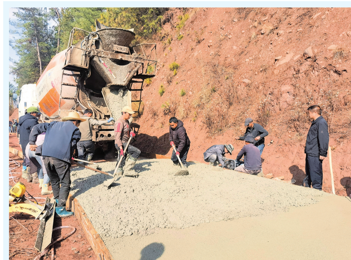
巍山县大仓镇干部群众在新胜村委会熊家营村铺筑进村水泥路面。(摄于3月27日)

降低交易成本。全面实行招标投标担保制度，不断降低投标人交易成本。所有进场交易项目投标人均可自主选择银行保函、保险等保证金缴纳方式。从2023年5月起对政府投资项目投标保证金一律实行减免，降幅不低于50%，2023年共计减免项目60个，减免金额761.4万元。截至3月20日，今年共减免项目11个，减免金额175.74万元。