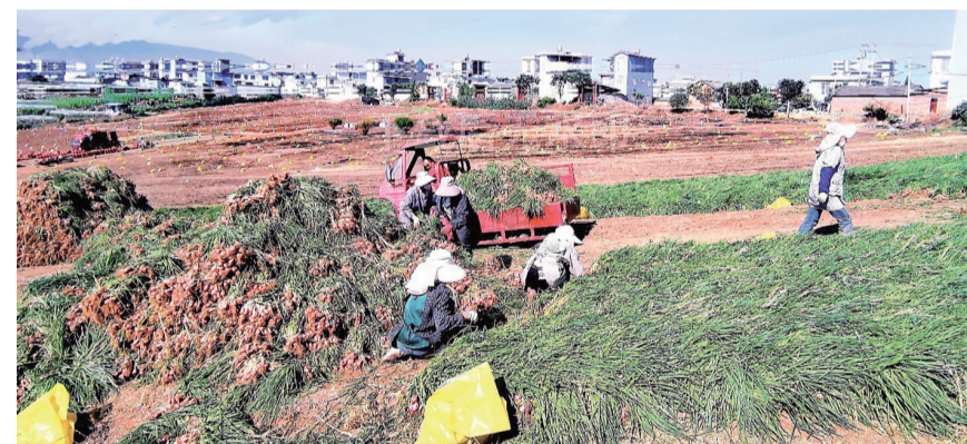
宾川县金牛镇纳溪社区，工人在晾晒小葱。(摄于3月25日)

强化宣传引导，提高防火意识。线上线下宣传相结合的方式，充分利用护林防火宣传卡点、应急广播、标语、微信群等，多形式、深层次、全覆盖开展宣传，确保森林草原防灭火知识深入人心，群众防火意识得到进一步提高。