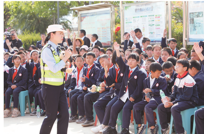
民警向学生们讲解交通安全常识。(摄于3月29日)

本报讯(通讯员 郑鹤源 杨艳芹文/图)3月29日,弥渡县公安局交警大队邀请弥渡镇永华完小300余名师生走进警营,“零距离”感受警营文化,了解交警日常工作,“沉浸式”学习交通安全常识。