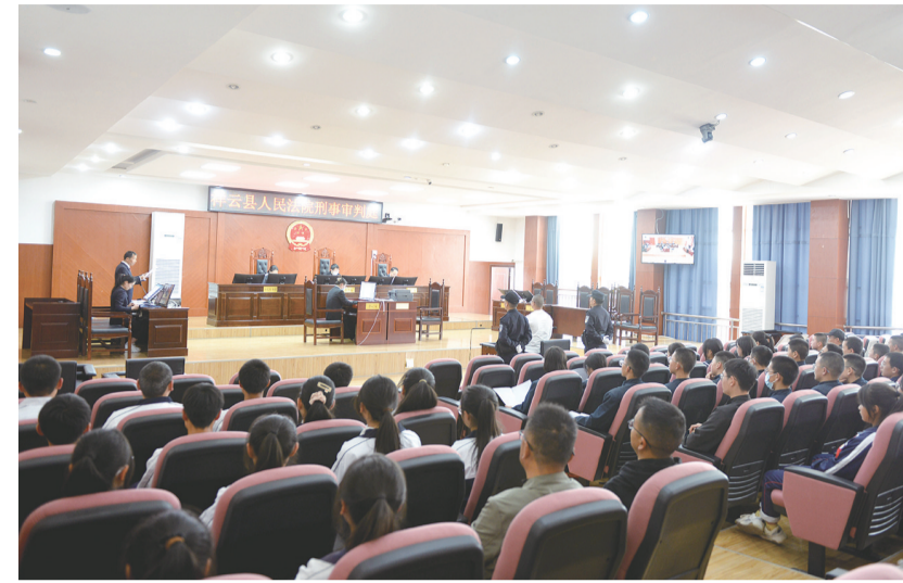
祥云县100余名学生走进法院庭审现场。(摄于3月28日)

本报讯(通讯员 杨嘉俊)3月28日,祥云县人民法院邀请4所中学100余名学生走进庭审现场,旁听了一起帮助信息网络犯罪活动罪案件的审理,通过旁听真实案件,让中学生“沉浸式”学法,进一步增强了青少年法治教育,帮助青少年提高电信网络诈骗手段的识别和防范能力。