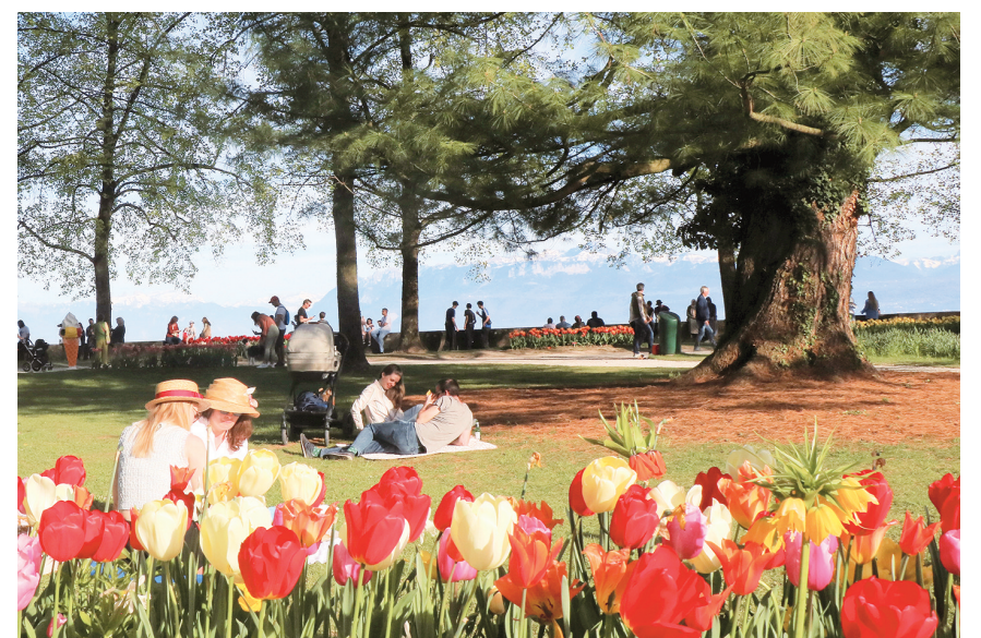
4月13日，在瑞士莫尔日，人们在盛开的郁金香旁休闲。

瑞士莫尔日3月29日至5月12日举办郁金香节，今年共展出超过350个品种的逾14万株郁金香。