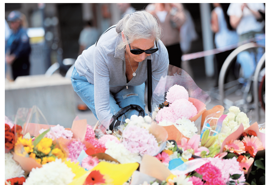
4月14日，在澳大利亚悉尼，一名女子在发生持刀袭击事件的商场附近献花，悼念遇难者。

新华社记者14日从中国驻悉尼总领馆了解到，针对13日澳大利亚悉尼一商场发生持刀袭击事件，中国驻澳使领馆多方反复核实，目前澳方确认事件中有一名中国公民死亡，另有一名中国公民受伤。中国驻澳使领馆将同死伤者家属、国内相关部门以及澳方保持联系，全力为相关后续事宜提供协助。