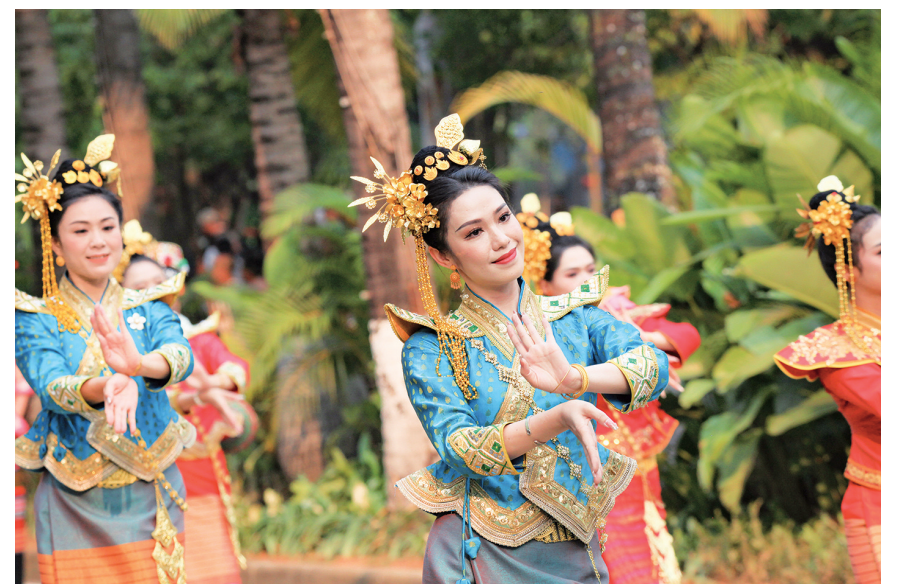
4月14日，群众代表在云南省景洪市参加民族民间传统文化游演。

当日，云南省西双版纳傣族自治州在景洪市举办泼水节民族民间传统文化游演活动，各族群众代表身着节日盛装载歌载舞，向市民和游客展示了丰富多彩的少数民族传统文化。