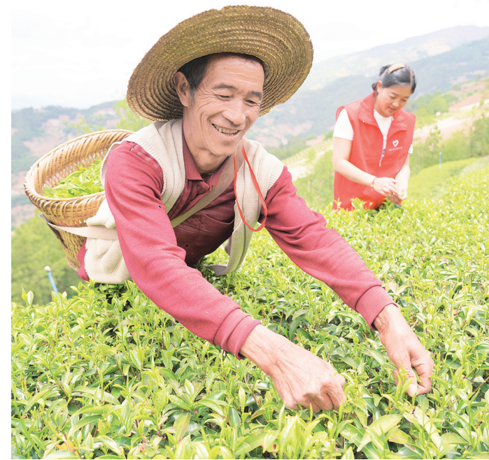
剑川县象图乡登村茶叶种植基地,助农志愿者与茶农一起采摘春茶。(摄于5月14日)

近年来,象图乡积极推行“党组织+公司+农户”产业发展模式,通过党员、致富带头人示范,引导村民种植羊肚菌、茶叶、花椒、荷兰豆等生态产品,促进村民增收致富,助力乡村振兴。