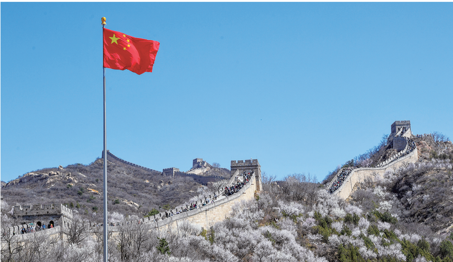
2024年4月7日，游客在山花盛开的八达岭长城观光游览。

2023年金秋，习近平文化思想正式提出，在新征程上高举起我们党的文化旗帜，标志着我们党对中国特色社会主义文化建设规律的认识达到了新高度，表明我们党的历史自信、文化自信达到了新高度。