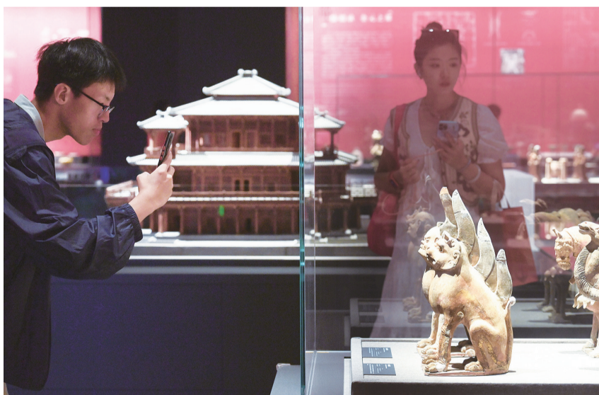
2023年9月15日，位于北京奥林匹克公园核心区的中国考古博物馆正式面向公众开放，观众在馆内参观珍贵文物。

“江山留胜迹，我辈复登临。”在习近平文化思想指引下，让我们以一往无前的奋斗姿态更好担负起新的文化使命，在实践创造中进行文化创造，在历史进步中实现文化进步，推动中华文明焕发光彩！