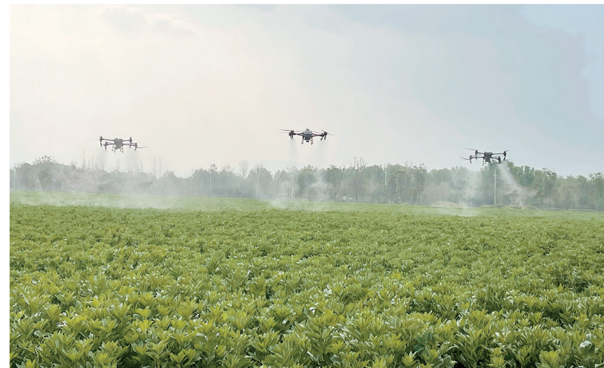
为扎实推进化肥减量工作,促进农业绿色发展,近期,大理市在辖区内17家经营主体开展化肥减量“三新”集成技术示范项目新技术推广,喷施面积10170亩。通过“三新”集成技术新模式的应用实施,不断削减农业面源污染,提高农业生产效率,降低农业生产成本,助力农业增收。

截至目前,全州各县已基本完成村级自建农村公路项目清单确定工作,巍山、南涧、剑川、祥云、永平、漾濞等县已启动部分村级自建农村公路项目建设,年内计划采取村级自建里程不少于300公里,占年度下达计划的30%以上,预计可避免地方政府债务增加9000余万元。