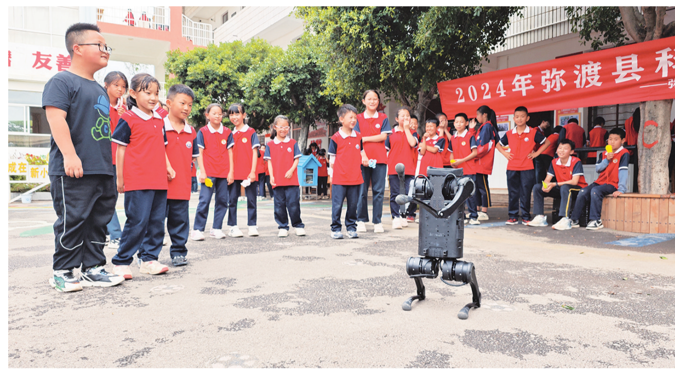
新街完小学生观看四足机器人表演。(摄于5月28日)

5月30日是第八个全国科技工作者日。当天,弥渡县委宣传部、县工业和信息化局、县科协联合县农业农村局、县卫生健康局、县公安局等10个部门联合在花厂广场开展科普集中宣传活动。围绕科技创新、预防电信诈骗、乡村振兴、农业科技、防灾减灾、预防疾病等方面,向群众发放宣传资料,现场讲解展示科技创新成果,开展义诊,营造热爱科学、崇尚创