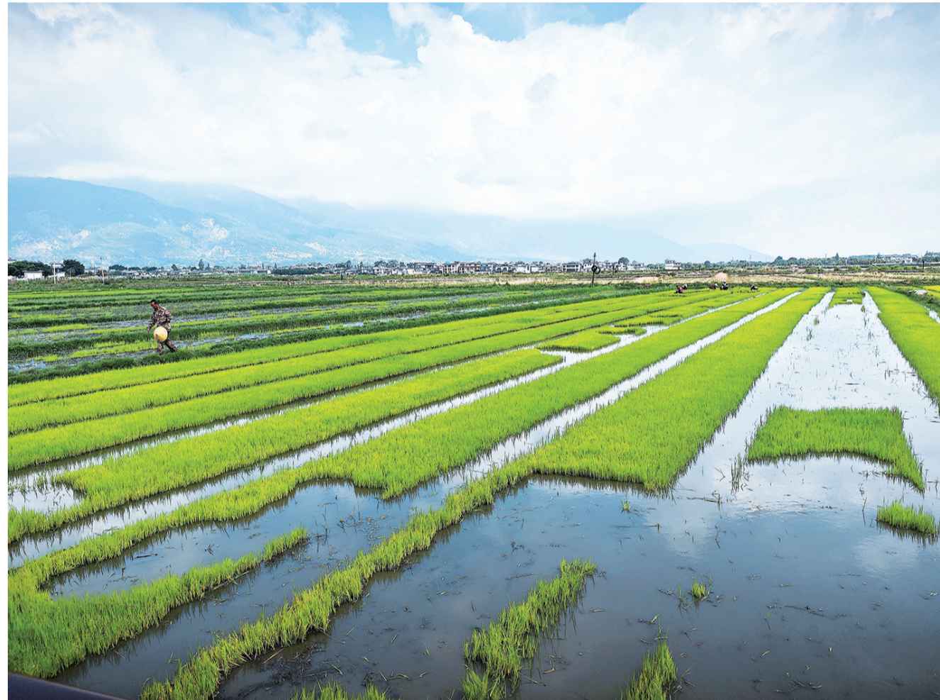
大理市喜洲镇寺里村村民在田间起秧苗。(摄于6月6日)

延伸“产”链条，让家门口的企业富起来。无量山乌骨鸡作为云南省“六大名鸡”之一，享誉省内外。宝华镇无量山乌骨鸡产业发展早、基础好，经过多年的发展培植，全镇先后建成了3个无量山乌骨鸡种鸡场、4个脱温场和1个无量山乌骨鸡养殖科技示范园区，全产业链体系已初具规模。依托现有优势，宝华镇不断加强无量山乌骨鸡产业链建设、全价值链开发，进一步打造“无量山乌骨鸡”品牌。截至目前，全镇共有万只养殖场3个、千只养殖场6个，成立了4个无量山乌骨鸡养殖专业合作社，全年年产无量山乌骨鸡苗达250万羽，年产值突破7000万元。