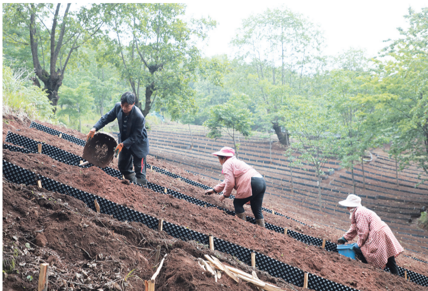
工人们在漾濞星瑞中药材种植有限公司中药材种植基地里劳作。(摄于5月29日)

花椒园村的实践只是漾濞县盘活山林资源的一个缩影。近年来，漾濞县依托188万亩林地，按照市场驱动、能人