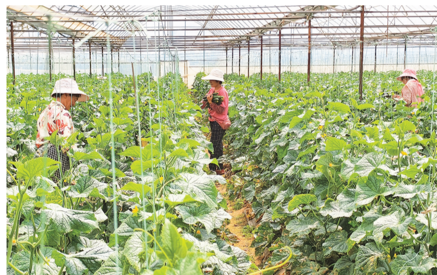
祥云大联农业科技有限公司的工人在采收黄瓜。(摄于6月5日)

服务发展“干在前”。团结乡把开展党纪学习教育与实际工作紧密结合，将党纪学习教育成果转化为党员干部担当作为的能力和本领，切实发挥其在推进民生保障、乡村振兴、优化营商环境等工作中的主体作用，推动全乡经济社会高质量发展。