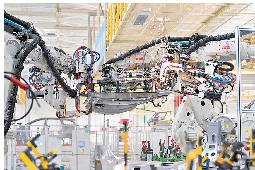
6月13日，在位于运城经济技术开发区的大运新能源汽车生产基地，智能焊接机器人在作业。

近年来，山西省运城市大力发展新能源汽车产业，不断推动生产制造向智能化、绿色化迈进，加快构建现代化产业体系。