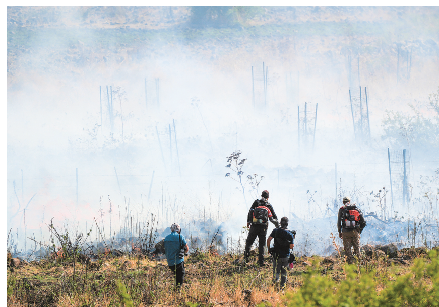
6月13日，浓烟在以色列控制的戈兰高地升起。

以色列国防军13日发表声明称，以色列北部加利利湖区及该国控制的戈兰高地当日下午遭45枚火箭弹和无人机袭击，引发火灾，多枚火箭弹及无人机被以军防空系统拦截。