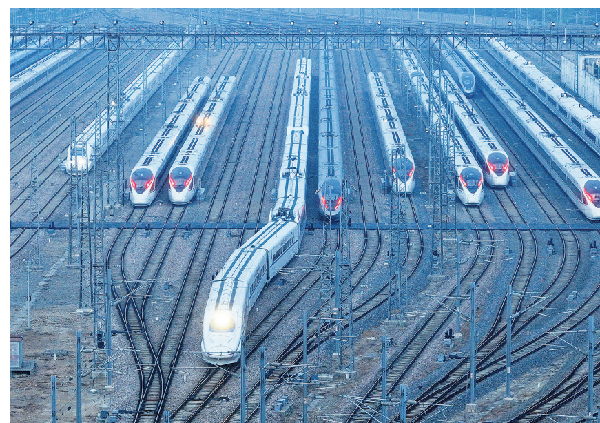
6月14日，动车从南京动车段南京动车运用所驶出(无人机照片)。

6月15日零时起，全国铁路将实行新的列车运行图。调图后，全国铁路安排图定旅客列车12690列，较现图增加205列；开行货物列车22595列，较现图增加74列，铁路客货运输能力、服务品质和运行效率进一步提升。