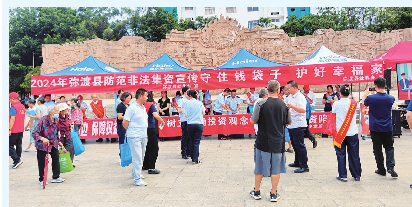
志愿者在弥渡县花灯广场开展防范和处置非法集资宣传活动。(摄于6月20日)

同时，南涧县完善应急预案，加强应急演练，常态化开展防汛隐患排查整治工作，强化会商和预警联动、预警响应机制建设以及安全宣传，加大隐患排查，确保安全度汛。