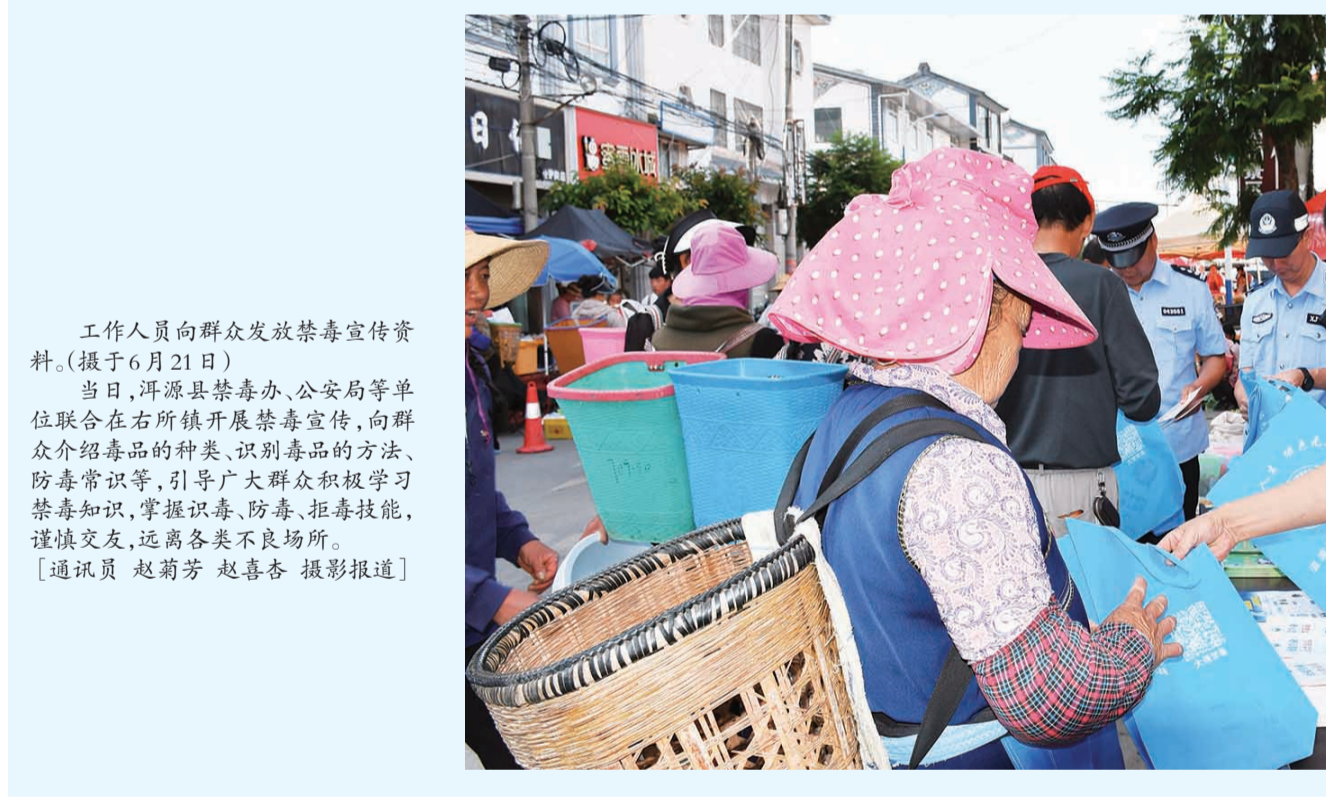
工作人员向群众发放禁毒宣传资料。(摄于6月21日)

当日，洱源县禁毒办、公安局等单位联合在右所镇开展禁毒宣传，向群众介绍毒品的种类、识别毒品的方法、防毒常识等，引导广大群众积极学习禁毒知识，掌握识毒、防毒、拒毒技能，谨慎交友，远离各类不良场所。