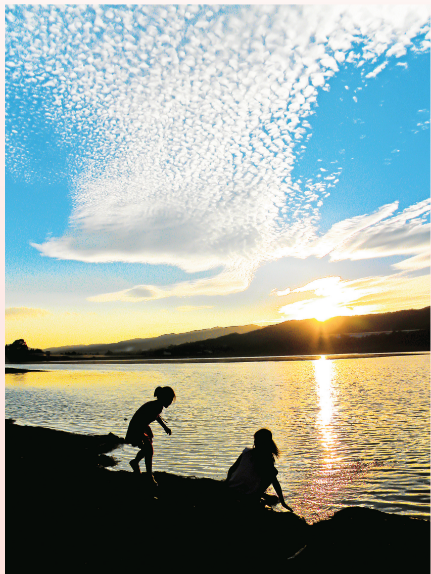
两个小朋友在青海湖边玩耍。青海湖是人们休闲娱乐的好去处。

堤填筑,新修长约10公里的环湖公路,建成湖面约3.82平方公里的水文景观,恢复了青海湖“水光如镜”的样子。