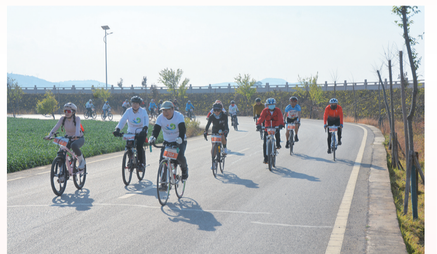
今年2月,祥云县在青海湖举办“大理有风·祥云有云”环青海湖自行车比赛。