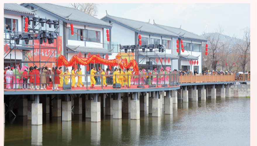
2月24日,群众在青海湖畔水涨地村水上舞台开展文艺演出。水上舞台建筑群是沙龙社区乡村振兴示范村的农文旅项目,也是景区让来客体验当地特色文化的场所。