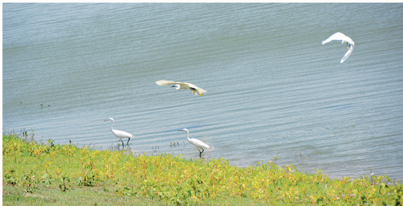
6月21日,一群白鹭在青海湖湿地觅食。湖水清澈,湿地常绿,鸟儿常驻,青海湖的生态美随处可见。