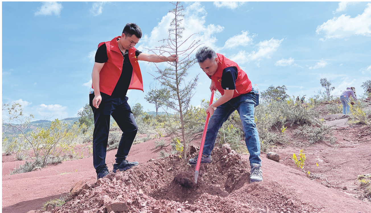
祥云县普湖镇组织党员、干部、群众开展义务植树活动。(摄于6月21日) 近年来,普湖镇聚焦村旁、水旁、路旁、边角地带等乡村公共空间,因地制宜,宜树则树、宜花则花、宜果则果、宜菜则菜,动员广大党员、干部、群众积极参加义务植树活动,千方百计增加绿地绿量,扎实推进绿美乡村建设。

抓培训、强实干,为乡村振兴培育“精英队伍”。把提升政治理论水平和引领发展能力作为镇、村干部培训的重点内容,让关键少数更好地发挥“头雁”作用。4月27日至29日,以发展农业新质生产力为主题,在县委党校举办了为期3天的乡村振兴专题培训班,全县10个乡镇党政班子成员、139个村(社区)党总支书记、驻村第一书记、驻村工作队员和县农业农村系统干部职工等600余人参加。把同台竞技作为检验实干能力的重要抓手,让镇、村干部在相互切磋中取长补短。4月28日,以“抓党建促乡村振兴”为主题的乡镇党委书记“擂台比武”开赛。10名乡镇党委书记轮流登上“擂台”,借助PPT演示文稿、图片、视频等,充分展示抓党建促乡村振兴的办法措施、成效亮点与规划思路。