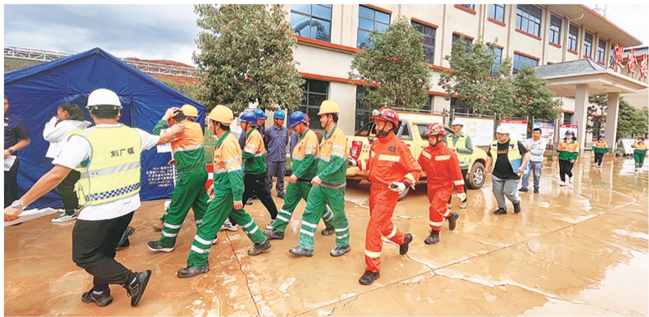
祥云县刘厂镇组织开展地震应急综合实战演练。(摄于6月27日) 6月27日,刘厂镇组织开展地震应急综合实战演练,检验抗震救灾指挥体系的调度效率、突发事件的处置能力和救援队伍的实战水平,增强干部职工和广大群众的防震减灾避灾能力,着力营造“人人讲安全、个个会应急”的浓厚氛围。

意。后来,我哥哥来看他的时候,他又叮嘱哥哥一定要帮他完成这个最后的心愿。” 2023年,是阮伟入党的第五十年。当沉甸甸的“光荣在党50年”纪念章挂在胸前时,阮伟激动不已,那也是他为数不多喜形于色的一天。“那天,我的父亲特别高兴,专门给我和哥哥打了电话,让回家吃饭,饭桌上还跟哥哥碰了几杯。他平时不爱说话,但那天他主动跟我们讲起以前在部队的生活,还一直说成为共产党员是他这辈子最骄傲的事……”阮林艳回忆道。 “他是共产党员的榜样。”这是百长村党总支副书记刘春丽评价阮伟最多的一句话。刘春丽表示,按照规定,农村党员每月交一元党费即可,以此来算,阮伟最后交的这500元钱,相当于他41年的党费。“他用实际行动,展现了一名党员、一名退伍军人的本色。”刘春丽说。