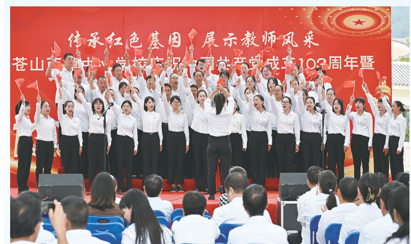
漾濞县苍山西镇中心学校举行活动迎“七一”。(摄于6月29日) 活动以“传承红色基因 展教师风采”为主题,以“唱红歌”歌咏比赛和文艺汇演的形式,歌颂党、歌颂祖国、歌颂新生活。[通讯员 常世伟 摄]