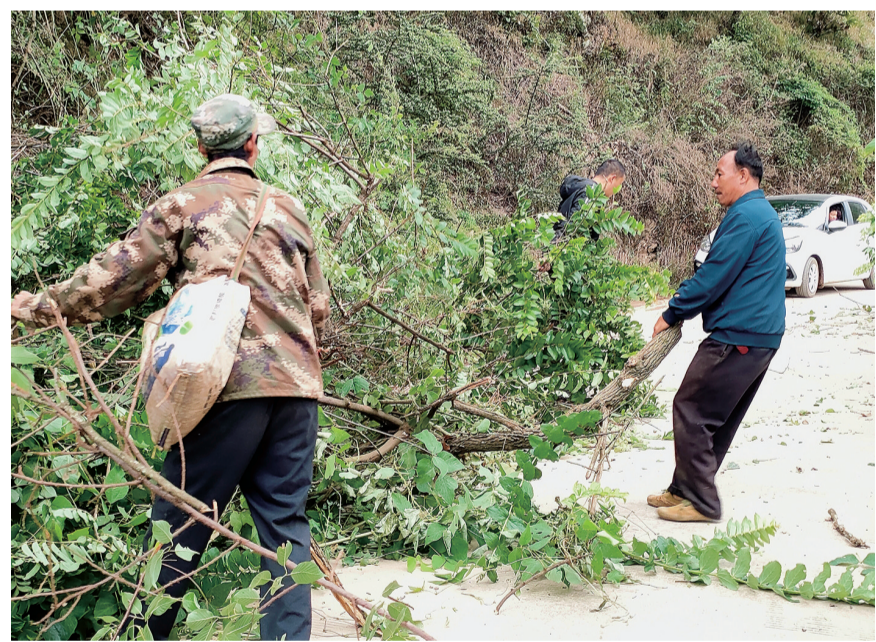
巍山县马鞍山乡青云村党总支组织党员、干部、群众及新时代文明实践志愿服务队开展乡村公路养护行动。(摄于6月25日) 今年以来,马鞍山乡坚持党建引领,广泛动员干部群众群策群力推进农村“四好”公路建设,让群众“山货出山”和日常出行更加便利。

民警重温入党誓词。 系列活动进一步凝聚了警心、鼓舞了士气,增强了广大民警的责任感和使命感,激励全体民警继承发扬革命先烈的优良传统,坚定理想信念,弘扬正气。