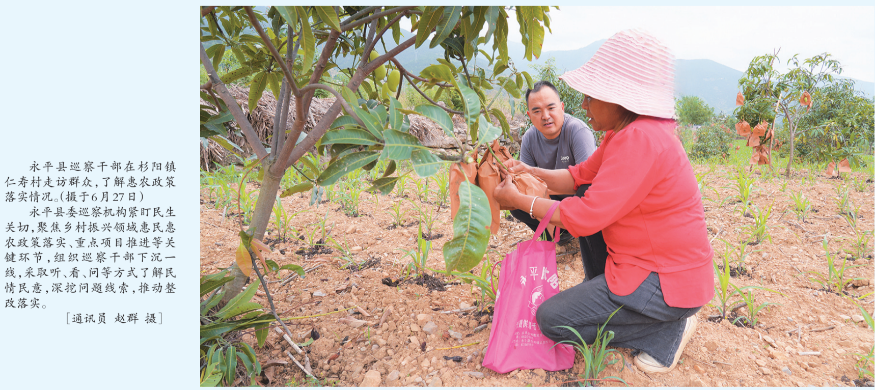
永平县巡察干部在杉阳镇仁寿村走访群众,了解惠农政策落实情况。(摄于6月27日)

永平县委巡察机构紧盯民生关切,聚焦乡村振兴领域惠民惠农政策落实、重点项目推进等关键环节,组织巡察干部下沉一线,采取听、看、问等方式了解民情民意,深挖问题线索,推动整改落实。