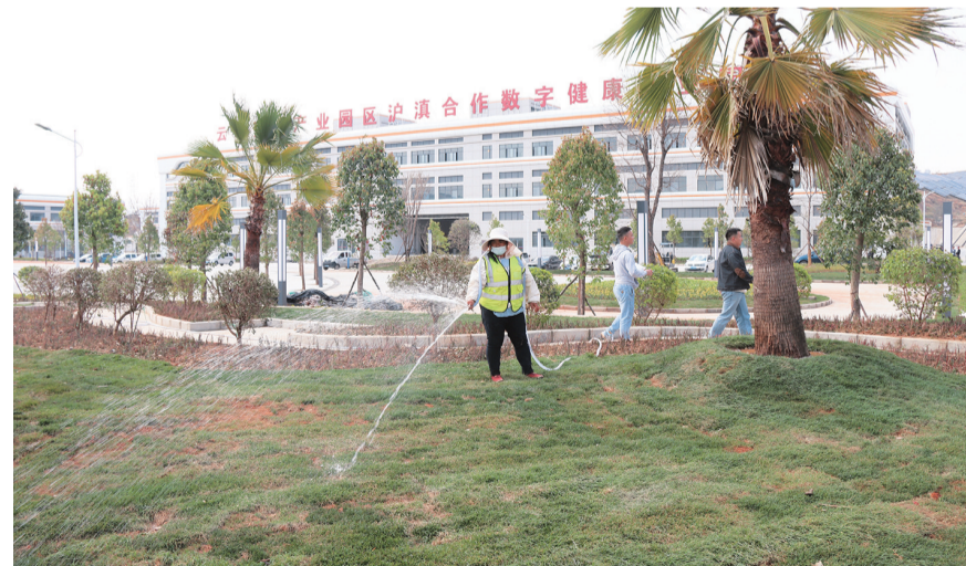
工人在弥渡产业园区区长岭片区管护绿植。(摄于7月2日)

弥渡县科学规划,打造绿化景观,改善生态环境,建设园林式产业园区,创造宜居宜业的环境,实现经济发展与环境保护良性循环。