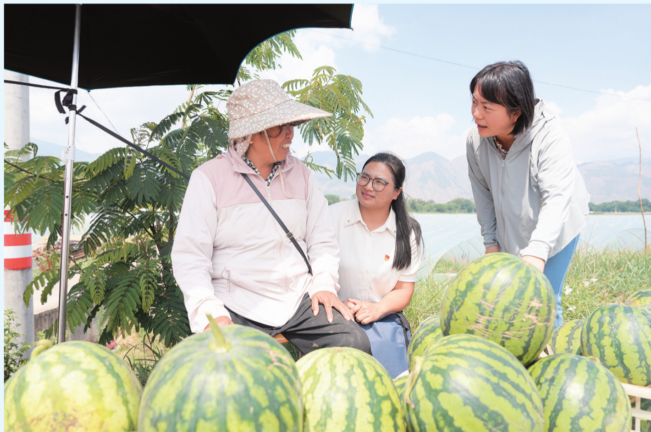
洱源县纪检监察干部在右所镇向群众了解惠农补贴落实情况。(摄于6月26日)

近年来,太平乡围绕“乡村振兴、产业先行”理念,调优产业结构,积极探索以高辣度辣椒为主的全产业链发展模式,实现产、供、销一体化发展,逐步实现产业特色化、规模化发展,有效促进产业提质增效,让高辣度辣椒种植真正成为群众增收的支柱产业。