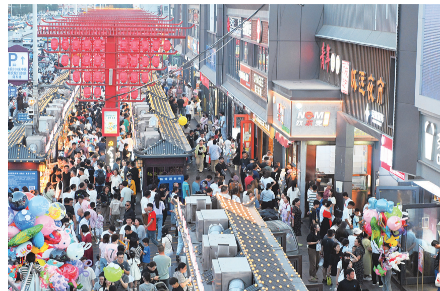
7月9日,游客在宁夏银川怀远夜市游览。进入暑期,宁夏银川怀远夜市游人如织,“夜经济”持续升温。各地游客在夜市品尝丰富多样的美食,感受银川的饮食文化和烟火气息。

新华社北京7月9日电 针对媒体反映的“罐车运输食用油乱象问题”,国务院食安办高度重视,组织国家发展改革委、公安部、交通运输部、市场监管总局、国家粮食和储备局等部门召开专题会议研究,成立联合调查组彻查食用油罐车运输环节有关问题。对于违法企业及相关责任人,将依法严惩、绝不姑息。同时举一反三,组织开展食用油风险隐患专项排查。调查处置结果将及时公布。