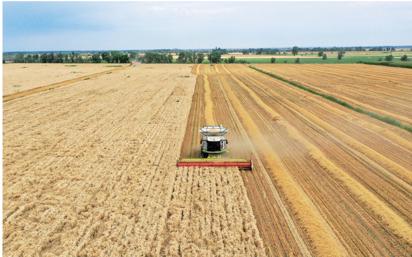
在新疆昌吉回族自治州奇台县西北湾镇,农户驾驶收割机收获小麦(7月9日摄,无人机照片)。近日,位于天山北麓的新疆产粮大县昌吉回族自治州奇台县迎来麦收季,当地农民抢抓晴好天气,组织机械加紧收割,确保夏粮丰收,田间地头一派繁忙景象。