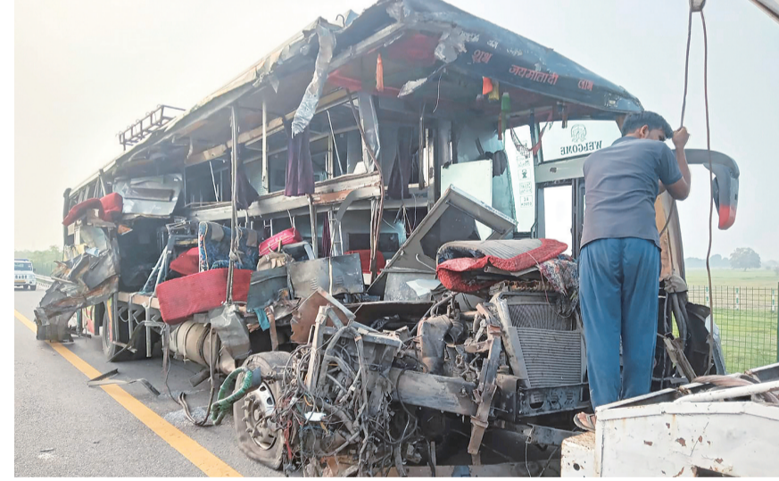
7月10日,在印度北方邦温瑞附近,一名工作人员清理事故现场。印度媒体报道,印度北方邦10日发生一起客运巴士与货运卡车相撞事故,造成至少18人死亡,多人受伤。