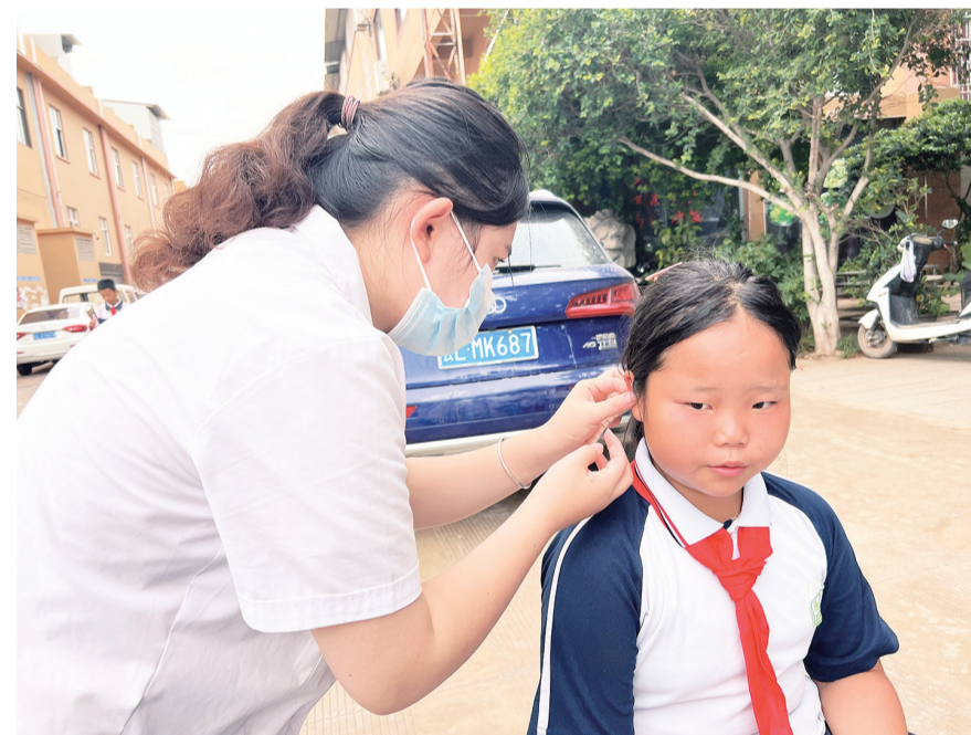
宾川金牛镇中心卫生院医生为群众贴耳豆。(摄于7月15日)

7月15日,金牛镇中心卫生院在群众较为集中的太和街新嘉源市场开展“传承千年智慧,守护群众健康”中医药文化服务月主题活动,组织中医科、外妇科、内儿科、检验科、功能科、放射科的21名党员医生和医务人员联合为群众进行义诊和中医药特色便民服务,并免费发放中药茶饮包、中医适宜技术理疗卡、体检卡。