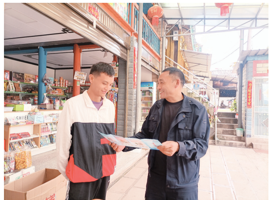
漾濞县太平乡干部职工向群众宣传野生菌中毒防控知识。(摄于7月16日)

据悉,每年的7月20日是“全国特奥日”,是专门为智力残疾人设立的一个特殊体育节日。永平县残联依托残疾人自强健身示范点建设、残疾未成年人基本康复服务等项目实施以及全国特奥日活动,每年组织开展季度趣味运动会、社区间残疾人体育联谊比赛等健康向上、形式多样、特色鲜明的特奥体育活动,并组建了一支残疾人健身体育运动队伍,帮助全县智力残疾人增强身体机能、提高自信心和社交能力,促进身心健康和全面发展。目前,全县各地越来越多的残疾人朋友通过自强健身示范点建设等平台积极参与康复健身运动,走出家门,走向赛场,充分感受体育运动的快乐,积极融入社会,“残健共融”在永平逐渐由愿景成为现实。“今后,我们将继续开展形式多样的残疾人群众体育活动,不断丰富残疾人体育活动内容,持续满足残疾人对美好生活的向往,共同营造平等、融合、共享的社会环境。”永平县残联理事长陈钰说。