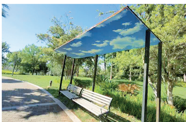
公园设置了固定椅，让人们可随处小憩。

海东新城公园群的特点是大而美，逛了半天，才逛了三个公园。大理海东开发管理委员会的工作人员介绍，海东新城以公园和水循环流域治理模式建成森林公园、湿地公园等23个，其中，九溪湿地公园是我省首个按照住建部倡导的海绵城市建设理念规划设计的雨水花园；起风公园是海东新区生态保护、生物多样性的样板和科普教育宣传基地；花田公园也有雨水收集的作用，一年四季都有不同的花卉开放，不同的植物可观叶色彩变化。还有掬秀园、涉溪园、独秀园、叶脉公园、锦水润水花园、荷月洲湿地公园等不同类型的公园。这些公园不仅美化了生活，提高了城市绿化率，同时也提升了大理的城市形象。到海东新城游玩，步步有惊喜，季季有花开，映雪路和洱月路的樱花，沐月街的蓝花楹，丹阳路的红花刺桐，城市中心公园的红枫，秀北山森林公园的玉兰、李花、桃花、紫薇、夹竹桃、火焰兰等都开得很美！