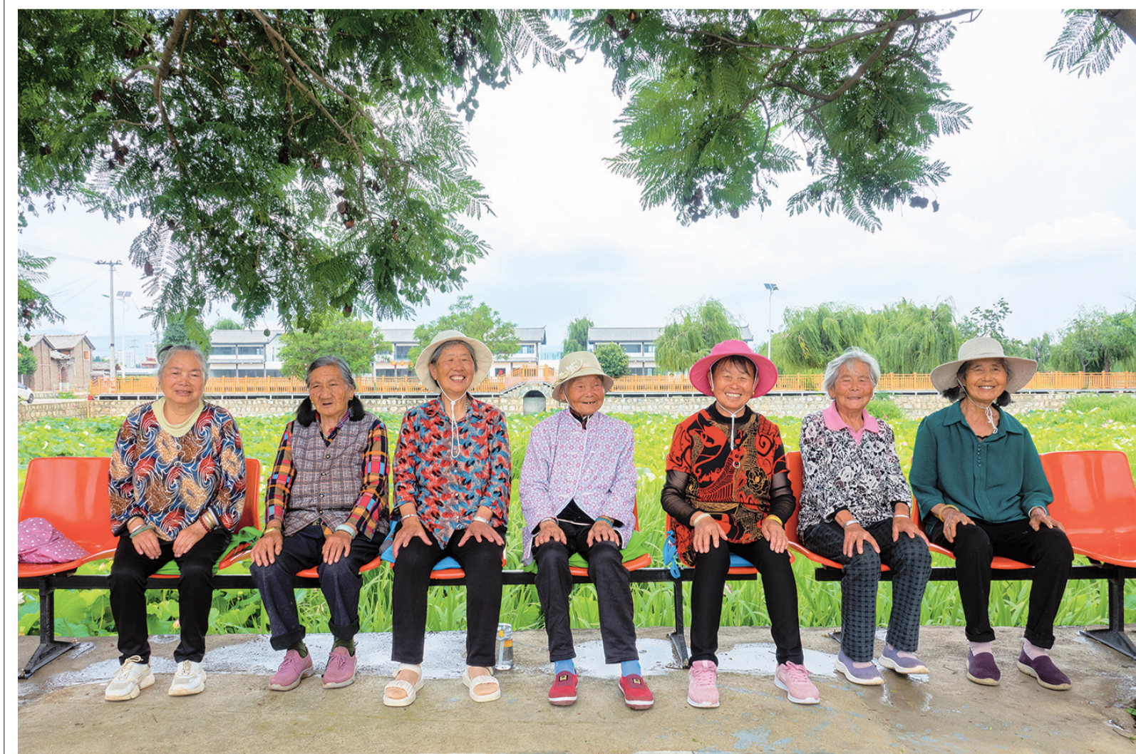
拍摄时间：七月二十六日 拍摄地点：祥云县沙龙镇水源地荷塘