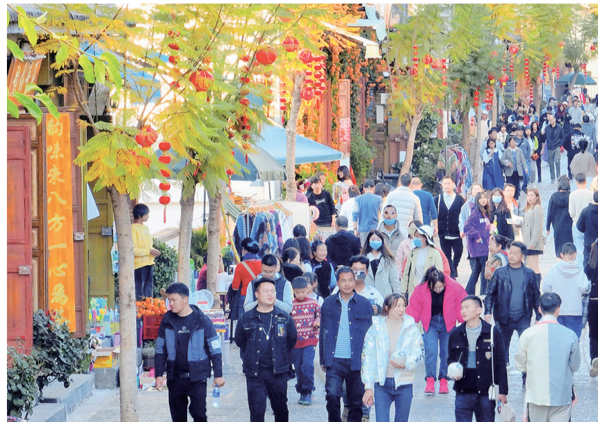
暑期，双廊街头游人如织。(摄于8月25日)