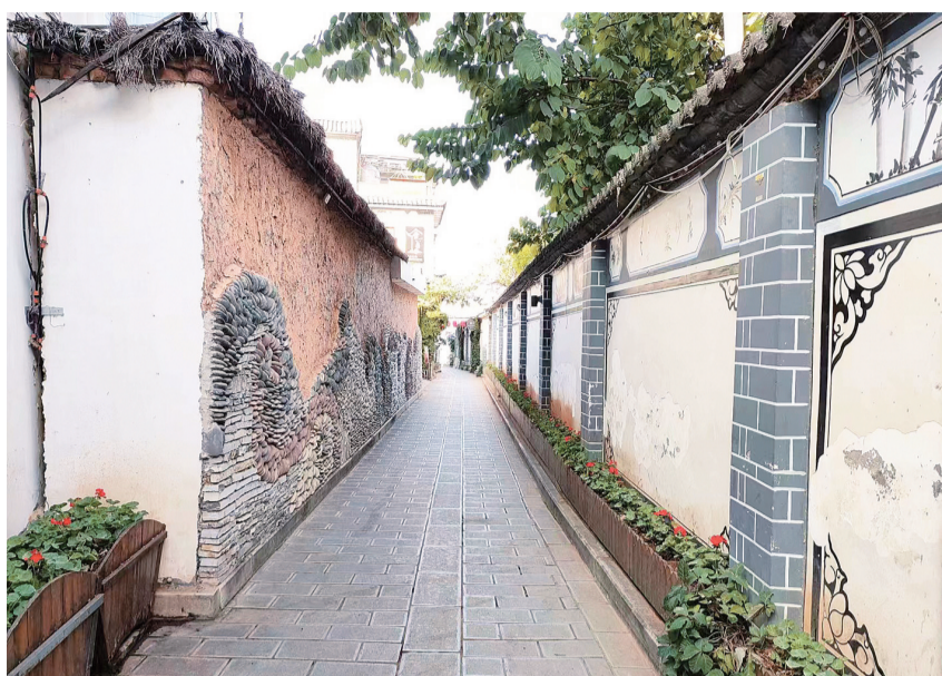
干净整洁的双廊镇巷间巷。(摄于9月6日)