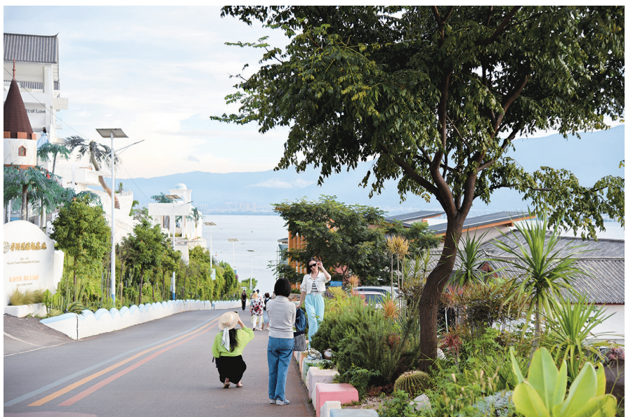
彭黎明 文 / 图

旅行就要去有风的地方，而大理就是有风的地方。大理的风不仅仅是自然之风，还是风情万种的民族之风、风花雪月的浪漫之风、诗和远方的文艺之风……在大理听风，最适合的地方当数洱海东岸，在这里听风、看云、观山海，风恰好，景恰好，风景恰好。