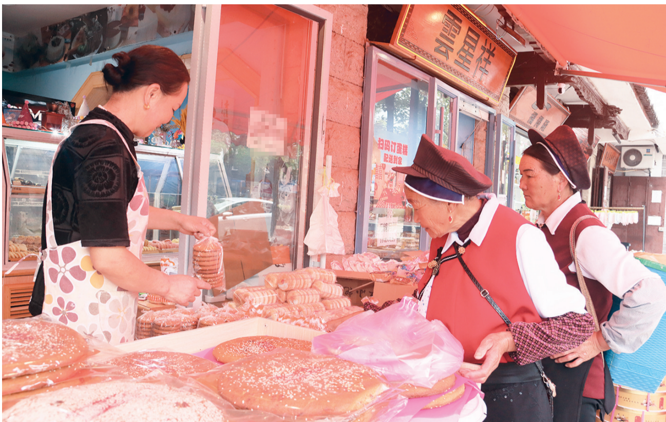
鹤庆群众在县城购买月饼。(摄于9月14日) 月饼是家家户户欢度中秋佳节的必备品。大红饼、小红饼、白饼,火腿饼、红糖饼、豆沙饼、玫瑰饼……各式各样、各种馅料的月饼让中秋的味道越来越浓。