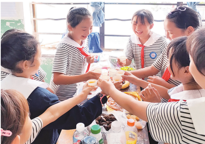
巍山县庙街镇古城村委会古城小学开展“情满中秋”活动。(摄于9月14日) 古城小学全校14个班以不同形式分别开展了中秋节主题班会活动,猜谜语、讲故事、吟古诗、唱歌、吃月饼……孩子们在学校过了一个愉快又难忘的中秋节。