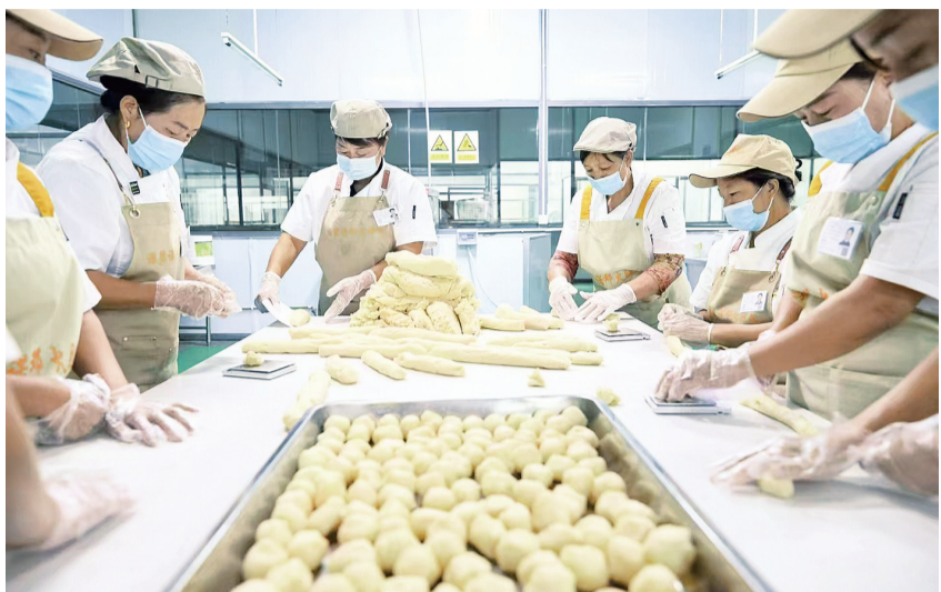
云龙县宝丰乡月饼生产车间的工人在赶制中秋月饼。(摄于9月13日) 据了解,宝丰乡有月饼作坊8家,每年中秋都会制作不同口味的月饼,通过零售、电商平台销售、直播带货等方式,将特色月饼销往全国各地。