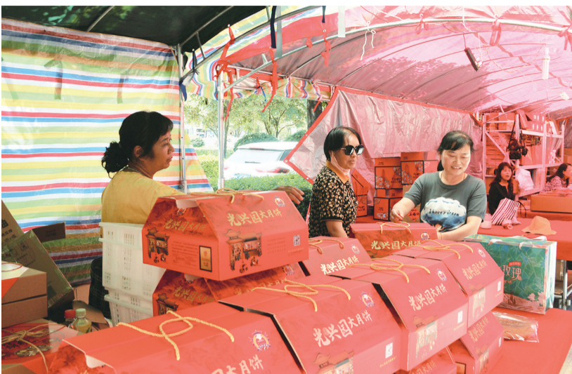
祥云群众在县城月饼一条街选购月饼。(摄于9月14日) 连日来,祥云县城乡各地月饼销售持续升温,琳琅满目的月饼占据了超市、商铺柜台“C位”,浓郁的中秋氛围扑面而来。 [通讯员 李树华 摄]