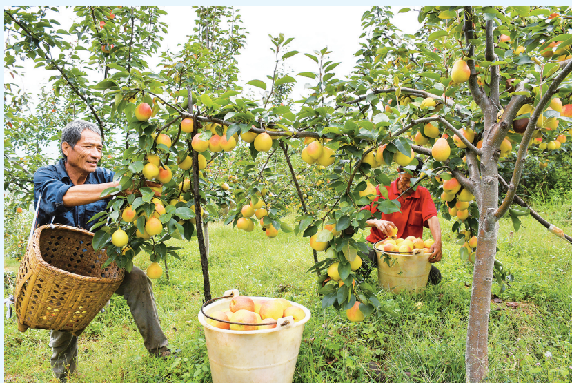
洱源县子圣种植场的蜜梨喜迎丰收，果农在采摘蜜梨。(摄于9月23日) 洱源县依托自然资源优势，引导农户发展特色林果产业，用“甜蜜产业”促进乡村振兴，实现产业高质量、乡村宜居宜业、农民富裕富足。