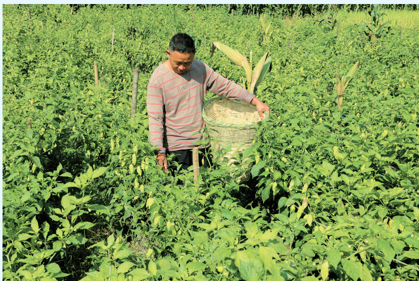
祥云县鹿鸣乡种植户在采摘工业辣椒。(摄于9月23日) 鹿鸣乡以“公司+合作社+党总支+农户”的种植模式，发展工业辣椒种植，为当地农户增收提供了新路径。