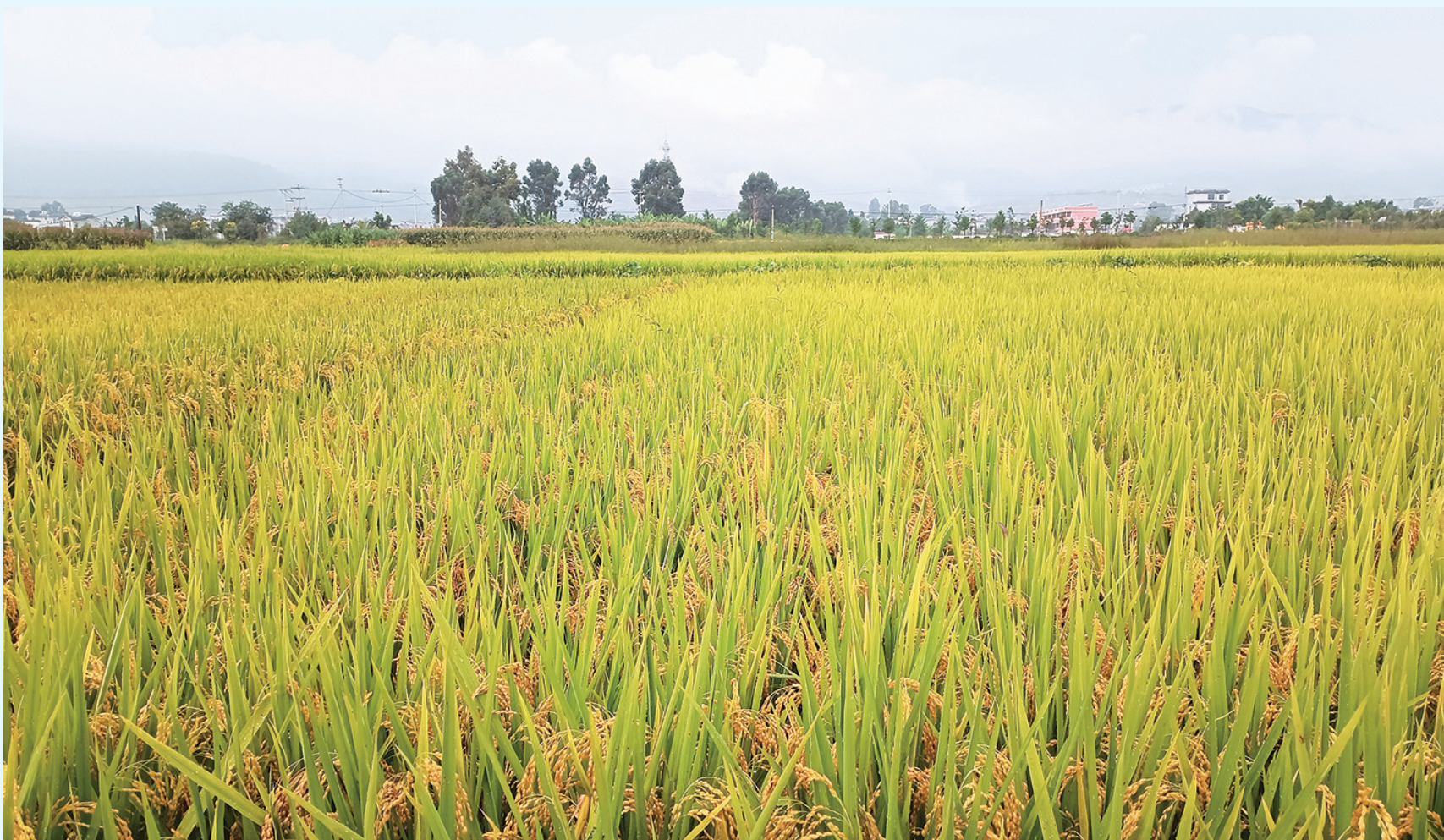
金秋时节，弥渡县弥城镇谷芹社区谷芹村，沉甸甸的谷穗呈现出一幅丰收的图画。(摄于9月17日) 弥渡县建设高标准农田，推广优质水稻品种，今年7.6万亩水稻长势较好，再获丰收。

感好、味道甜，受到广大消费者的喜爱，“马登苹果”逐渐成为享誉县内外的水果品牌和地域名片，有力地推动了种植户增收致富。