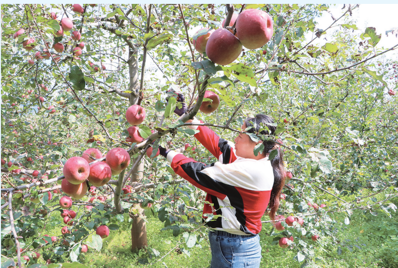
果农在采摘苹果。(摄于9月18日)

种植有红富士、爱妃、嘎啦、红露、红将军等10余种品种。得益于高海拔地区气候优势，以及种植户科学管护，马登镇产出的苹果色泽艳丽、病虫害少，口