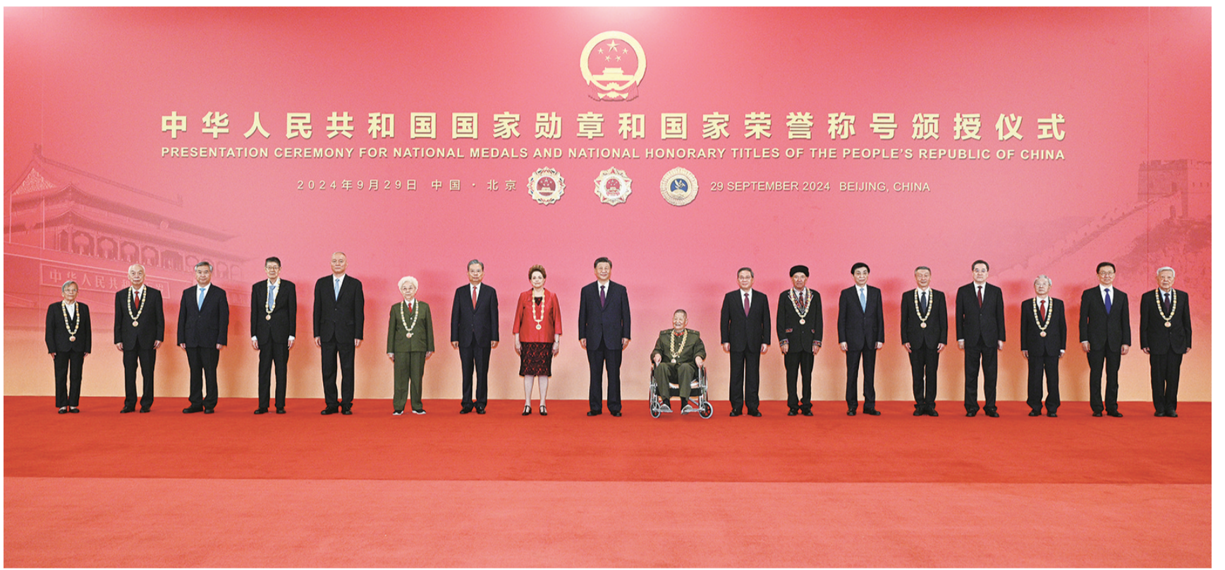
9月29日,中华人民共和国国家勋章和国家荣誉称号颁授仪式在北京人民大会堂金色大厅隆重举行。习近平等领导人同国家勋章和国家荣誉称号获得者合影留念。

新华社北京9月29日电 中华人民共和国国家勋章和国家荣誉称号颁授仪式29日上午在北京人民大会堂金色大厅隆重举行。中共中央总书记、国家主席、中央军委主席习近平向国家勋章和国家荣誉称号获得者颁授勋章奖章并发表重要讲话。习近平强调,伟大时代呼唤英雄、造就英雄。英雄辈出,党和人民事业就会兴旺发达、长盛不衰。各级党委和政府要关心关爱英雄模范,推动全社会尊崇英雄、学习英雄、争做英雄。希望受到表彰的同志珍惜荣誉、再接再厉,争取更大荣光。