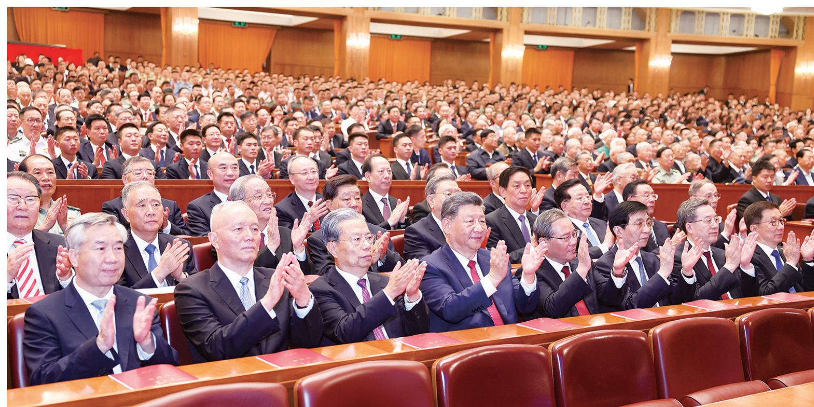
9月29日晚,庆祝中华人民共和国成立75周年音乐会在京举行。习近平、李强、赵乐际、王沪宁、蔡奇、丁薛祥、李希、韩正等党和国家领导人,同3000多名观众一起观看演出。

管弦乐《第一交响序曲》、大合唱《黄河大合唱》气势磅礴,充分展现新民主主义革命时期中国人民浴血奋战、百折不挠,在党的领导下夺取伟大胜利、建立新中国的光辉历程。《祖国颂歌》铿锵热烈,《丰收之歌》欢快喜悦,2首管弦乐重温了社会主义革命和建设时期自力更生、发愤图强的难忘岁月,激起现场观众的强烈共鸣。管弦乐《北京喜讯到边寨》、民族器乐联奏《多彩的交响》融合不同民族、不同地域的特色音调,以优美的旋律讴歌祖国大好河山和人民幸福生活。