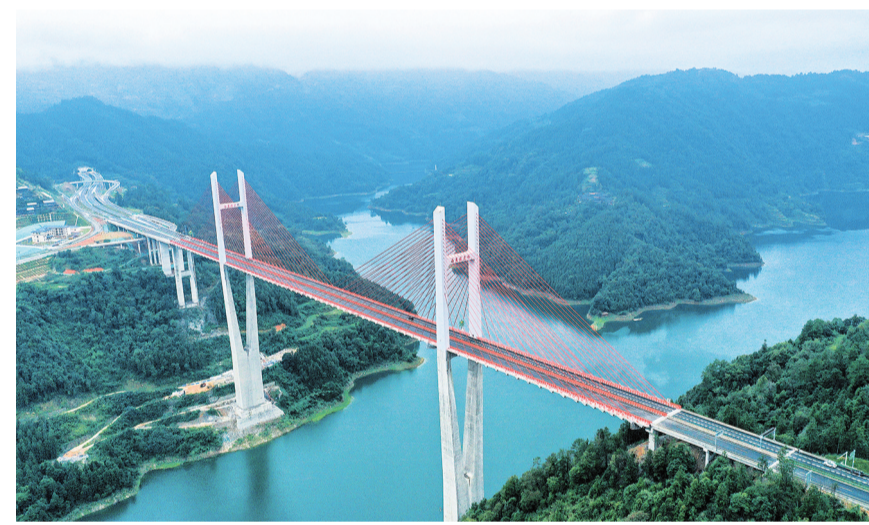
这是10月20日拍摄的贵州剑黎高速南孟溪大桥(无人机照片)。目前,由中国铁建昆仑集团等投资建设的贵州剑河至黎平高速公路各项建设已接近尾声,预计今年内通车试运营。

剑黎高速公路全长74.754公里,建成通车后,剑河县与黎平县之间车程将缩短至1小时左右,对构建黔东南黄金旅游通道、加快沿线资源综合开发、助力乡村振兴具有重要意义。