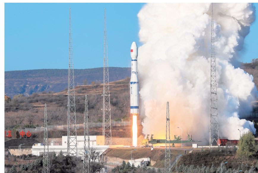
10月22日8时10分,我国在太原卫星发射中心使用长征六号运载火箭,成功将天平三号卫星发射升空,卫星顺利进入预定轨道,发射任务获得圆满成功。