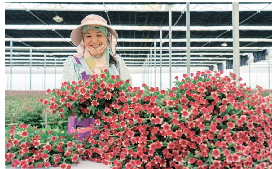
花农正在申洱花卉产业园基地采花。