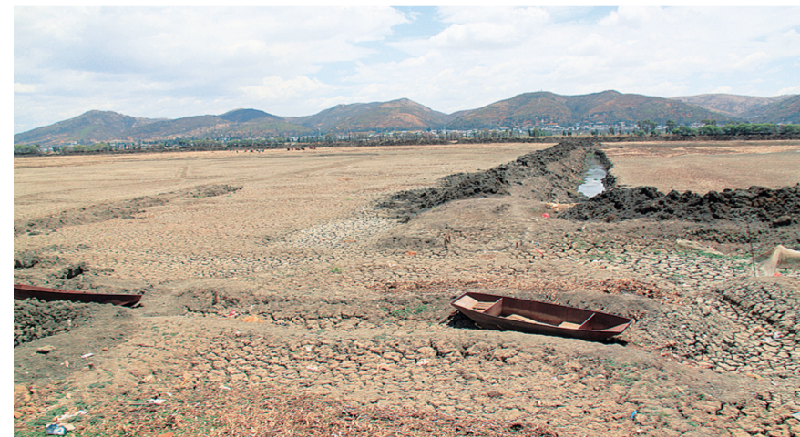
项目建设前，干枯的祥云青海湖。