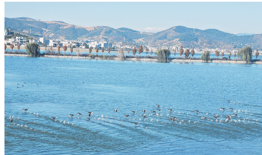
项目建设后，青海湖上群鸟飞。