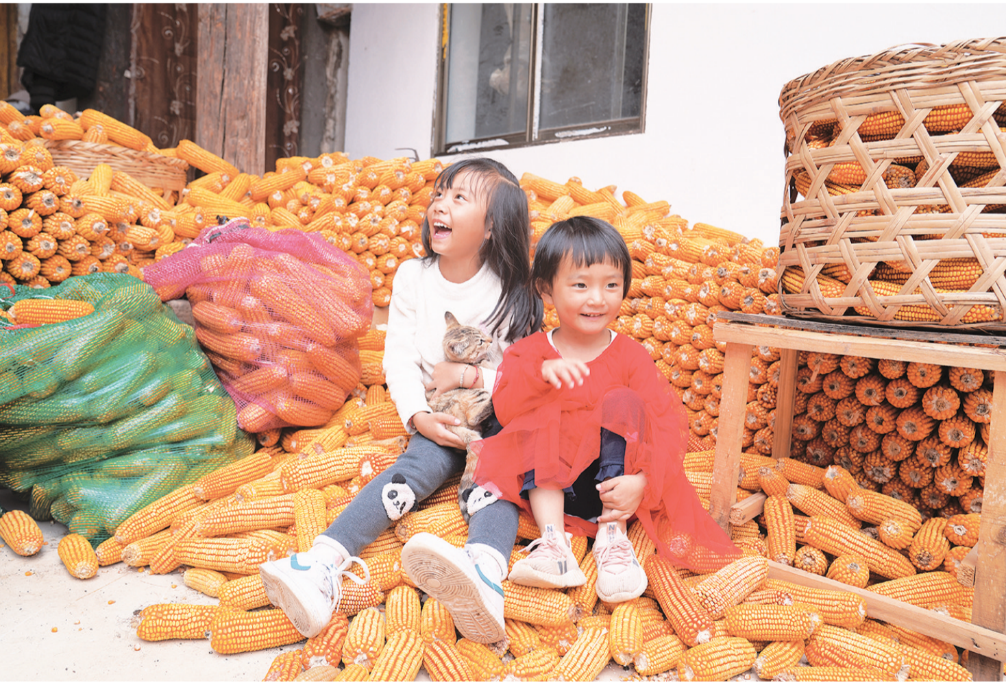
拍摄时间：二〇二四年九月二十七日