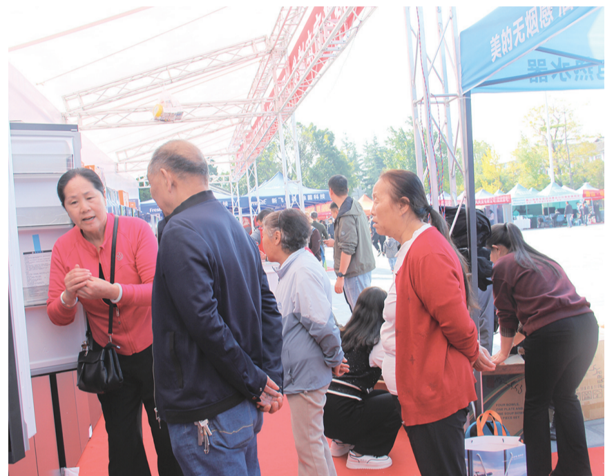
群众在了解消费品以旧换新相关政策。(摄于10月19日) 10月19日至20日，巍山县聚焦新能源汽车和家用电器2个重点消费领域，在县城南诏文化广场举办2024年消费品以旧换新集中展销活动，向消费者展示以旧换新的优惠政策、产品种类和品质，提升消费者消费意愿及水平，实现让群众在“家门口”便利消费，获得政策补贴享“实惠”。