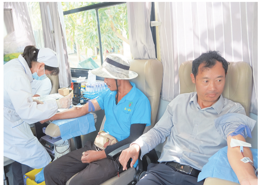
宾川县鸡足山镇干部、群众在进行无偿献血。(摄于10月15日) 当天，鸡足山镇在炼洞村委会组织开展无偿献血活动，广大干部、群众踊跃参加，用博爱心和实际行动诠释了“生命有限，爱心无限”。此次献血活动共有200余人报名，献血成功120余人。