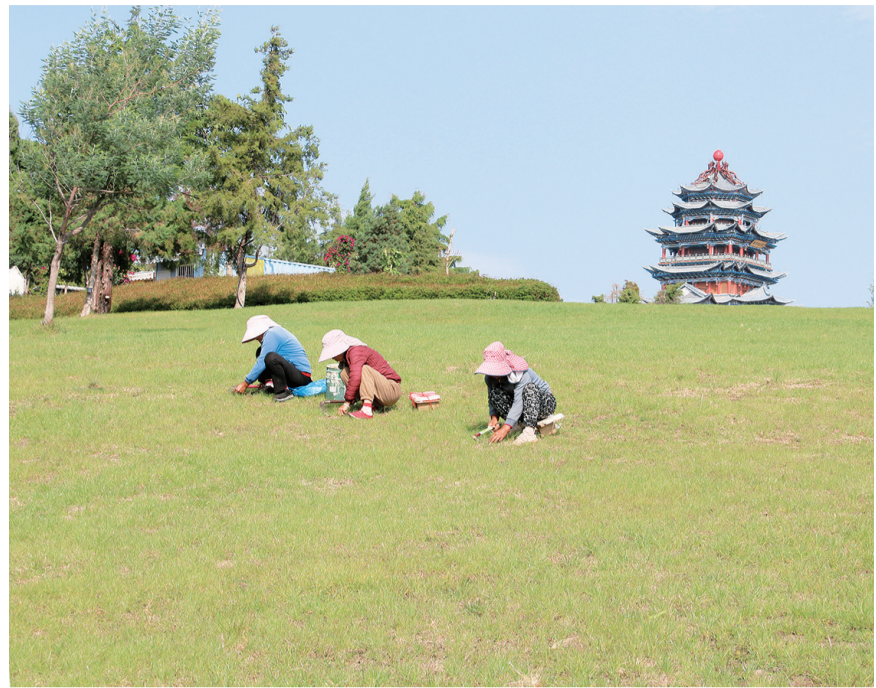
园林工人在祥云县彩云南园公园内清除杂草。(摄于10月19日) 近年来，祥云县以规划为引领，统筹推进公园、绿道、廊道、道路等城市公共空间绿地建设，进一步优化城市绿地布局，构建绿道系统，实现城市内外绿地连接贯通，着力增强城市绿地的系统性、协调性，全力打造宜居宜业绿美县城。

县人大常委会把找准问题、深挖症结、科学建议作为审议监督工作的关键，从调研工作入手，强化工作联动、畅通信息渠道、灵活方式方法，确保监督工作的依法、有序、规范、深入。注重将“表现在基层、根子在上面”的问题以高质量的调研成果转化成为高质量的议案建议，转化为党委、政府决策参考，转化为相关部门解决问题的方案和对策；探索将制度优势转化为治理效能的方法路径，积极推动从解决“一件事”向破解“一类事”转变；加强与部门监督联动、有效衔接，建立向县委、县人民政府及有关机关移交监督中发现问题和问责建议机制，形成“民呼我应”的长效监督效果，有力提升了监督质效。