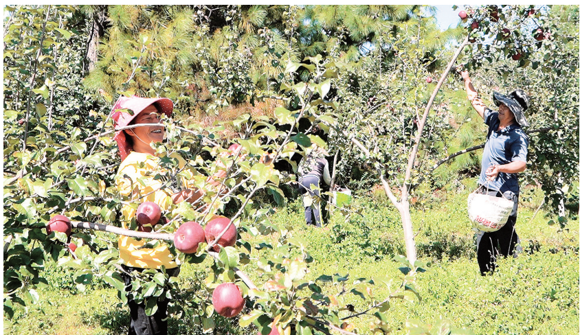
金秋时节,宾川县平川镇李子园村委会8000亩苹果迎来丰收季,果农们忙在果园里采摘。(摄于10月18日)

李子园村种植的苹果以红富士和红将军两个品种为主,今年挂果的8000亩苹果预计产量可达4000余万斤,产值约9000万元。