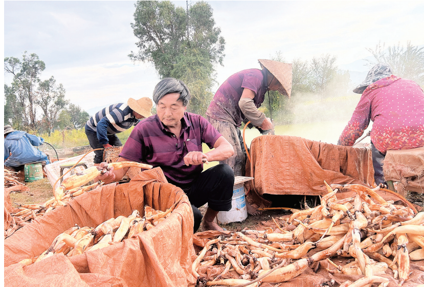
双堆村村民在清洗、分拣莲藕。(摄于10月16日)

庙街镇作为巍山县农业发展大镇,近年来,锚定高原特色现代农业示范镇定位,立足资源优势,因地制宜、