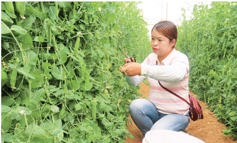
务工群众在祥云泰兴农业科技开发有限责任公司标准化蔬菜种植大棚采摘豌豆。(摄于10月23日)

祥云泰兴农业科技开发有限责任公司是农业产业化省级重点龙头企业,建成标准化蔬菜种植示范基地4580亩,发展订单基地1万多亩,种植30多个特色蔬菜品种,年产蔬菜5万吨。