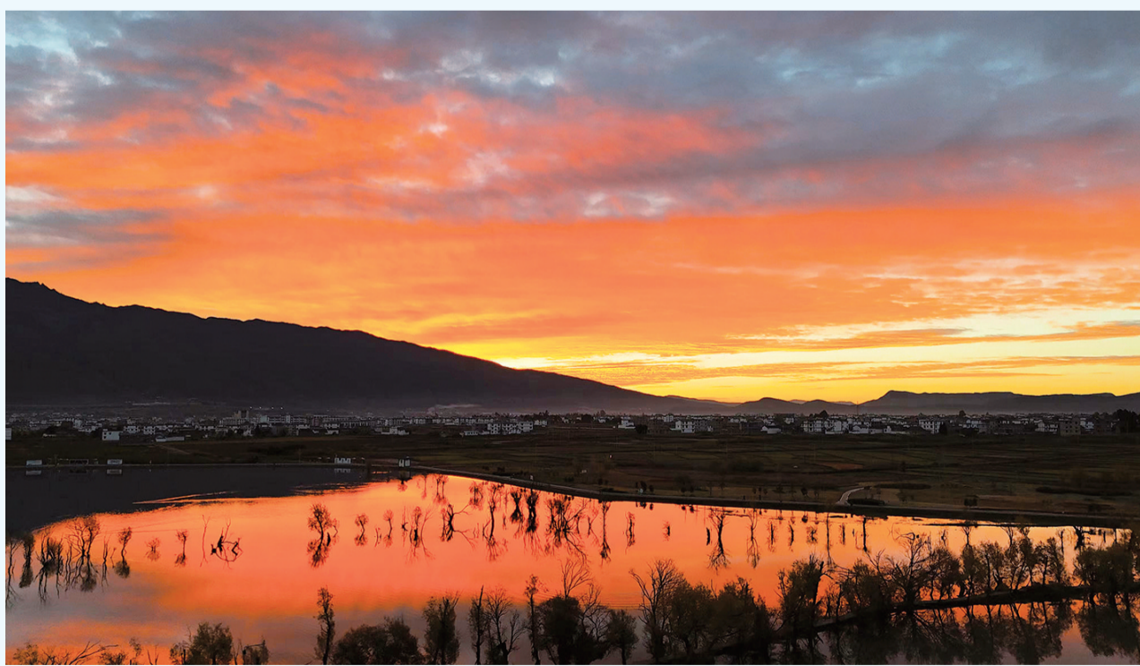
进入秋冬季节，鹤庆县黄龙潭朝霞艳丽，与古柳相映成趣，成为鹤庆龙潭水乡的一道绚丽风景。(摄于11月22日)