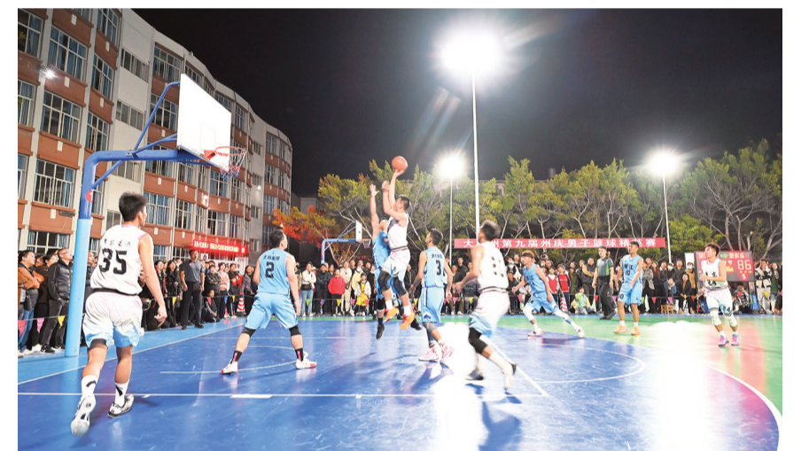
11月27日，2024年大理州第九届州庆男子篮球精英赛赛场上，丽江队对战普洱市景东队。当日，精英赛冠军争夺赛、季军争夺赛、第五名争夺赛相继开赛。

工作站的具体内容进行了详细交流。专家工作站建立后，大附院心血管内科将从医疗、教学、科研多方面对永胜县第二人民医院进行线上、线下帮扶指导，助力该院心血管内科发展，更好地为永胜县人民群众服务。