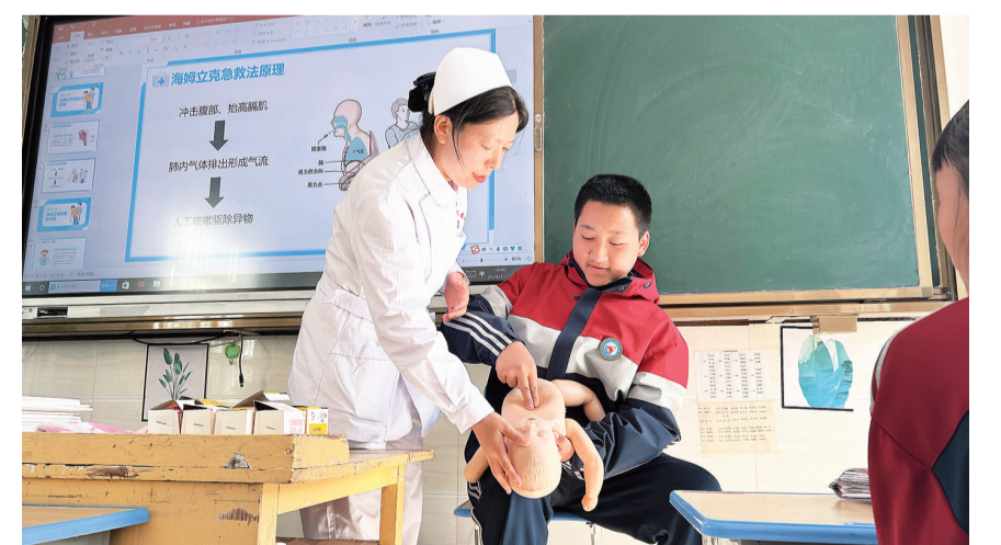
云龙县宝丰乡初级中学的同学在宝丰乡卫生院医务人员的指导下学习海姆立克急救法。(摄于11月13日)

日前，宝丰乡卫生院开展急救知识进校园活动，为学校师生普及急救知识，增强师生安全防范意识，掌握应对突发事件的自救、互救基本技能。