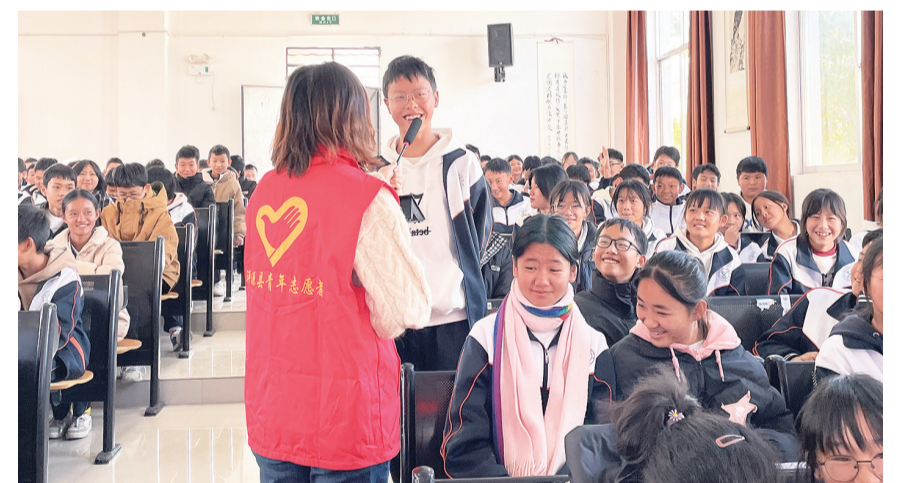
11月26日，洱源县青年志愿者走进洱源县三营初级中学，开展“利剑护蕾·青”心守护”未成年人保护志愿服务活动。

青年志愿者结合预防未成年人犯罪、防性侵、防欺凌等内容为同学们开展法治教育讲座，切实增强未成年人的法治意识和自我保护意识。当天，共200余名师生参加了活动。