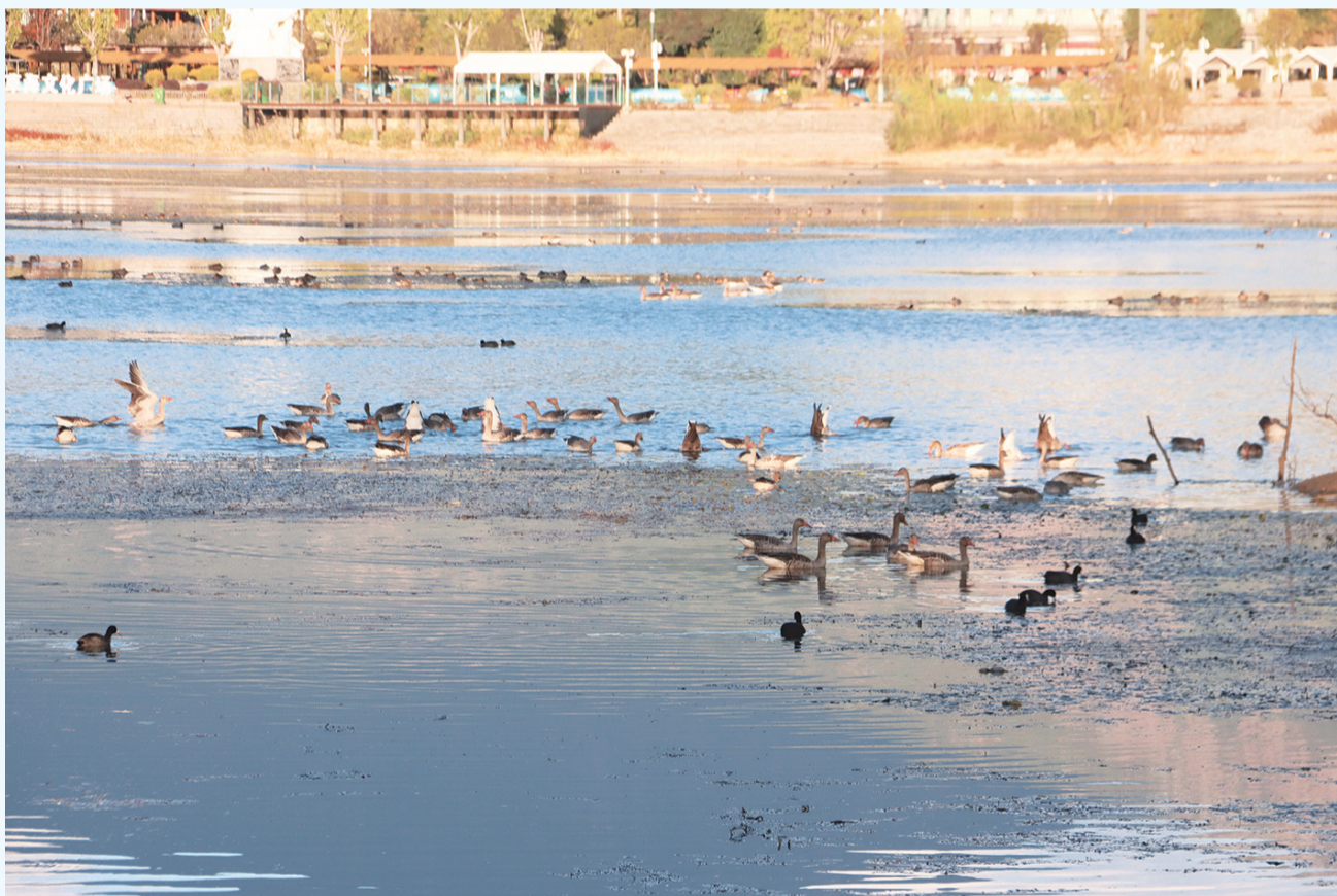
鹤庆县西草海候鸟翔集。(摄于11月20日)

鹤庆草海湿地总面积1000公顷以上。西草海和东草海为湿地保护的核心区，平均水深1.6米，最大水深2.6米，年入库水量达240万立方米。