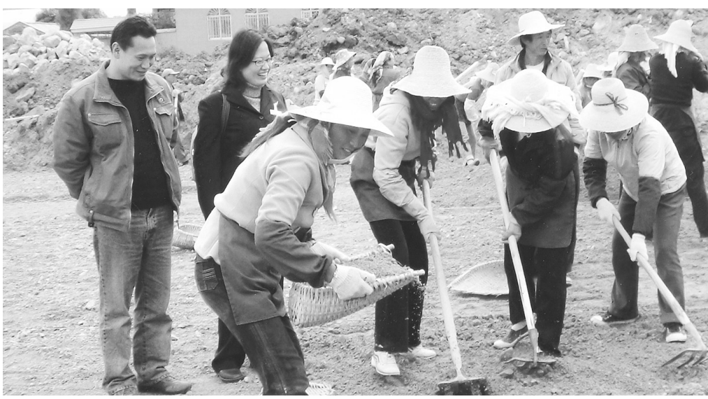
大理市农村合作银行积极支持小城镇建设和旧村改造以及公共事业建设,使“村美户富”的新农村及早从规划变成现实。近日,下关支行信贷员深入到下关镇大把关村了解二水厂建设情况。

服务功能明显增强,经济效益大幅提高。推出了“惠农金桥”业务,代理涉农补贴“惠农一折通”,把国家各项惠农补贴8100万元兑付到农民手中,与财政、烟草、教育等部门合作开展代收、代付等金融服务项目。完善了银行卡、现代化支付等系统功能,银行卡业务、中间业务等快速发展,财务收入持续增长,全州农村信用社预计实现利润6500万元以上,创历史新高。