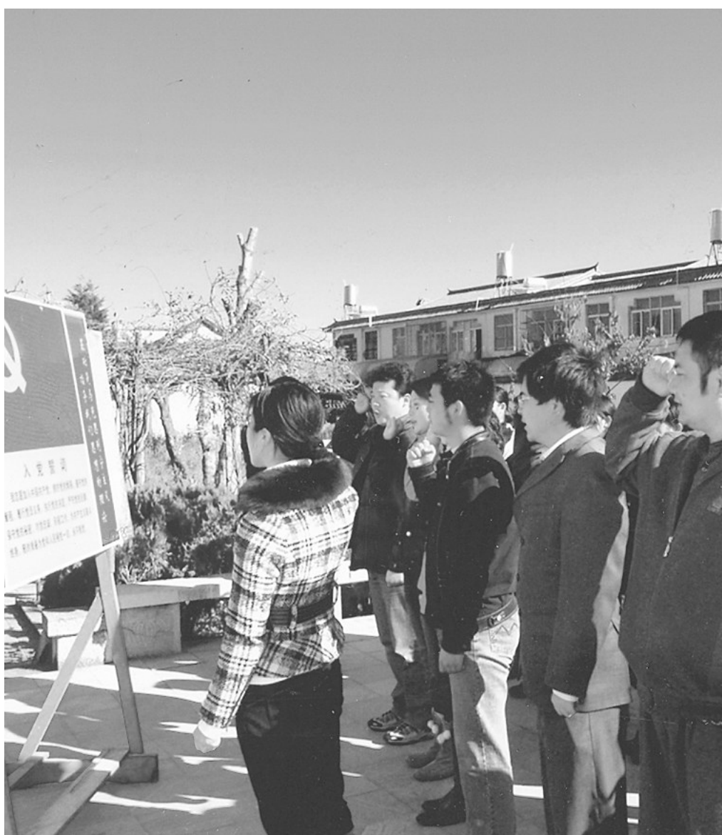
近日,大理市广播电视管理局党委组织新党员和入党积极分子到爱国主义教育基地湾桥镇周保中将军纪念馆参观学习,进行爱国主义教育。新党员在周保中将军塑像前举行入党宣誓。