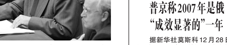
12月27日,联合国安理会召开紧急会议,就暗杀巴基斯坦前总理贝·布托事件以及巴国内局势等问题进行磋商。随后发表的主席声明严厉谴责暗杀事件,并呼吁巴民众保持克制,维护国家稳定。

新华社华盛顿12月28日电(记者杨晴川 王薇)美国白宫发言人施坦策尔28日说,美国对巴基斯坦核武器的状况很放心,并认为在巴前总理贝·布托遇刺后,巴核武器并没有落入极端分子手中的危险。 随同总统布什在得克萨斯州克劳福德农场休假的施坦策尔对媒体说,据他所知,美国情报界的评估意见认为,巴核武器是安全的。他同时承认,对贝·布托遇刺后巴局势可能发生变动的担心,是目前美巴两国官员在进行磋商时共同关注的主要问题。 他还透露,美国政府正在与巴各界人士进行接触,包括与巴陆军参谋长基亚尼就政治和安全方面的问题进行过讨论。 贝·布托27日在巴基斯坦首都伊斯兰堡邻近的拉瓦尔品第市参加竞选集会时遇刺身亡,此间舆论认为这一事件有可能严重影响巴政局稳定。