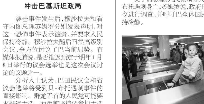
12月29日,乘客在上海轨道交通8号线人民广场站通过验票闸机出站。

招致一些仇恨西方的恐怖组织憎恨的原因。此外,贝·布托政治主张的世俗化倾向也遭到恐怖分子和极端势力的忌恨。 冲击巴基斯坦政局 袭击事件发生后,穆沙拉夫和看守内阁总理苏姆罗分别发表声明,对这一恐怖事件表示谴责,并要求人民保持冷静。穆沙拉夫随后召集高级别会议,全方位讨论了巴当前局势。有媒体报道说,是否推迟定于明年1月8日举行的议会选举也是这次会议讨论的议题之一。 分析人士认为,巴国民议会和省议会选举将受到贝·布托遇刺事件的直接影响。群龙无首的人民党可能要求推迟大选。而生前坚持要参加大选的贝·布托去世,则有可能使原来勉强同意参选的党派重新联合起来抵制大选。前总理、穆斯林联盟(谢里夫派)领导人谢里夫在贝·布托去世后立即宣布抵制大选。 与此同时,穆沙拉夫如何应对贝·布托遇刺这一突发事件,也值得重点关注。穆沙拉夫的任何举动都可能引起反对派的反弹,使不满情绪迅速蔓延。 据最新报道,贝·布托遇刺的消息传出之后,人民党支持者在伊斯兰堡、拉瓦尔品第、卡拉奇、白沙瓦和奎达等主要城市上街抗议,并制造了一些骚乱事件。 总之,随着竞选活动的白热化,巴政党间的矛盾与冲突将在所难免。贝·布托遇刺事件无疑将使巴未来政局进一步复杂化。如何控制这一复杂局势将是穆沙拉夫及看守政府面临的