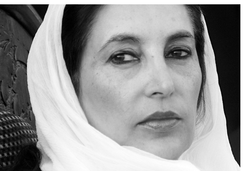
2007年12月27日遇袭前,贝·布托在竞选集会上致支持者。

新华社北京12月29日电(记者李敬臣)巴基斯坦前总理、人民党主席贝·布托27日在参加竞选集会时遇刺身亡。由于贝·布托在巴国内具有较高的政治影响力,在国际上也具有较高的知名度,因此对她的行刺引起国际社会广泛而强烈的谴责。巴局势也再度成为世界关注的焦点。分析人士认为,这一事件再次显示巴安全局势依然脆弱,必将影响巴今后政局走向,特别是即将举行的议会选举产生重大影响。 被法院以谋杀政治对手为由判处死刑。贝·布托时年26岁。1988年,35岁的贝·布托就任总理,成为巴历史上第一位女总理。1993年,她再次就任总理。1999年,巴一法院认定对她的腐败指控成立,但后来撤消了这一裁定。随后贝·布托开始流亡生涯。2007年10月,她结束了流亡生涯回国。贝·布托不凡的政治经历使她成为备受关注的一个人物。 贝·布托一直主张加大对恐怖主义和极端势力的打击力度。10月19日,她在一次记者招待会上表示,即使自己的生命受到威胁也决不向恐怖主义和极端主义低头。她也因此成为巴境内外恐怖分子和极端分子的袭击目标。当然,她与西方的密切关系也可能是她