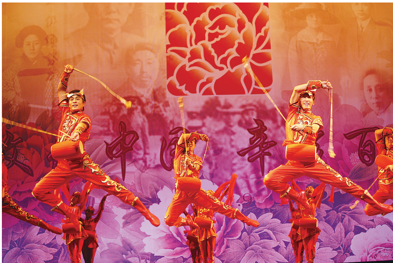
9月18日,在美国休斯敦卡伦剧院,中央民族歌舞团演员表演《花鼓》。由中国国务院侨办组织的“文化中国·辛亥百年”赴北美艺术团当日在美国休斯敦卡伦剧院举行演出,为当地华人华侨和美国观众奉献了一场具有中国特色的晚会,庆祝中华人民共和国成立62周年和纪念辛亥革命100周年。

2011年国际象棋世界杯赛8月28日开赛,共有46个国家和地区的128名棋手参赛,中国选手有九人入围,不过包括王皓、王玥、侯逸凡在内的8名棋手止步前两轮比赛,卜祥志只身杀入16强,但被伊万丘克淘汰。