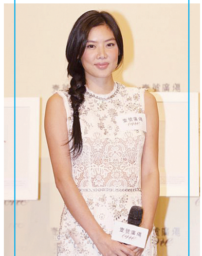
近日,乐基儿(Gaile)到澳门出席活动,活动后被追问婚变传闻,Gaile一概不予回应,有指黎明没有跟她庆祝生日,她仍表示不会回答。