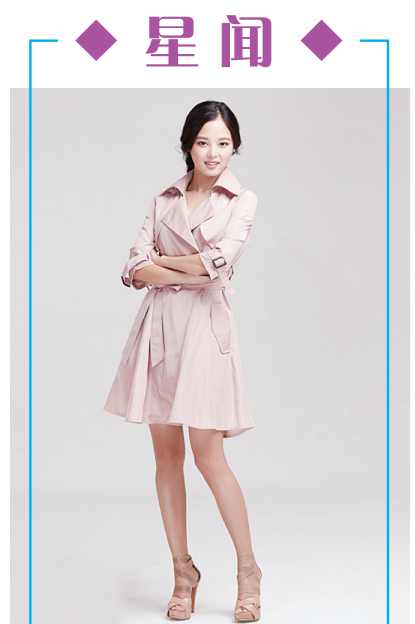
气质美女辛芷蕾近日拍摄了一组粉色风衣写真,身材高挑,气质优雅迷人。据悉,由辛芷蕾、韩雪、丁子峻领衔主演,唐季礼监制、蒋家骏执导的内地版《情定大饭店》已进入紧张的后期制作阶段。