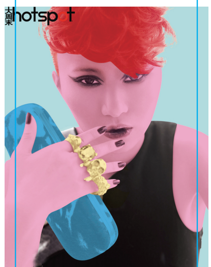
日前,歌手尚雯婕再次登上时尚杂志《大周末Hotspot》的9月刊封面,拍摄了一组关于“旧衣新穿环保有型”的环保时装大片。