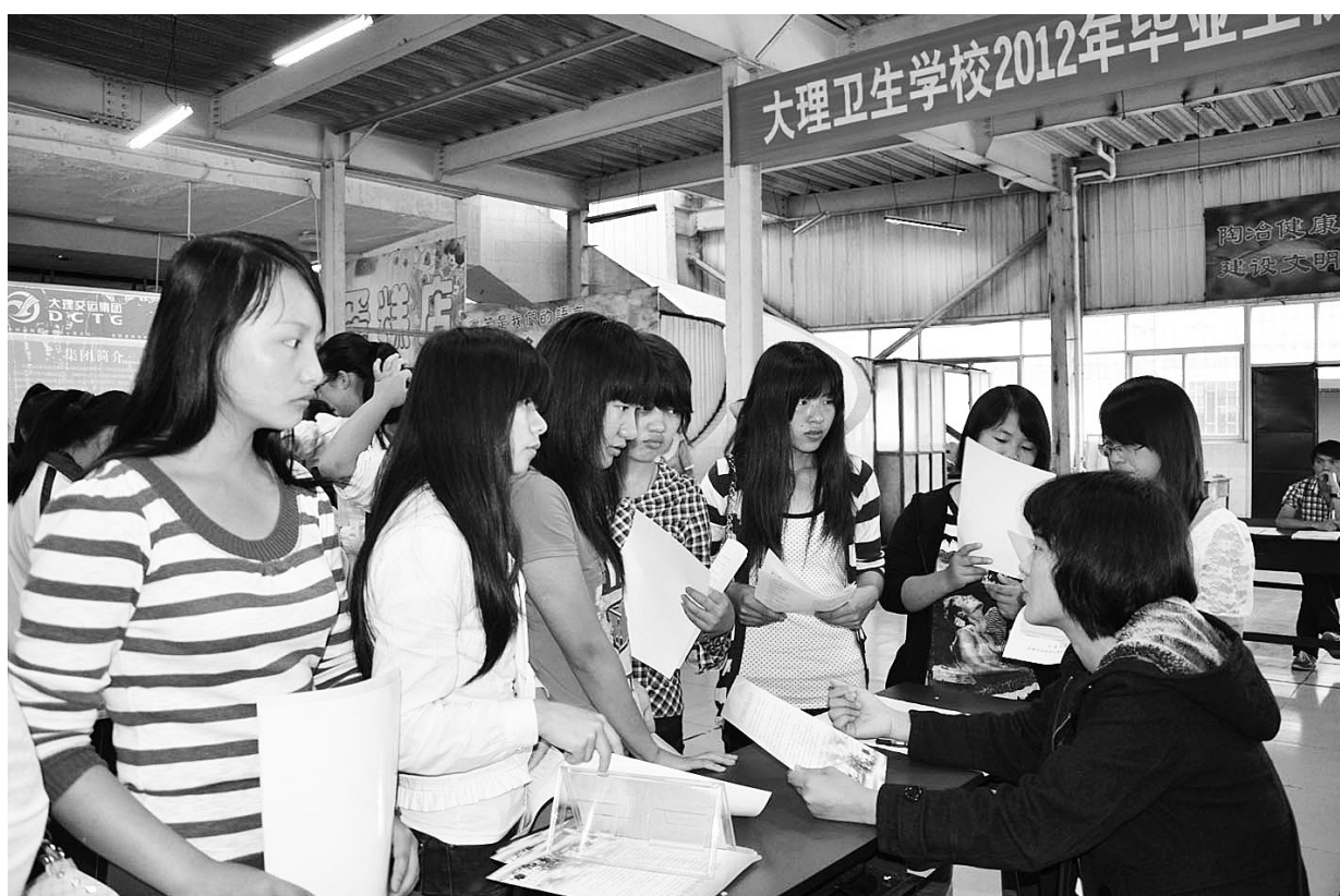
6月30日,大理卫校与大理人才市场举行2012年毕业生供需见面会。据悉,该校现开设有中专护理、助产、中医、农村医学、康复技术和眼视光与配镜6个专业,全日制在校生规模达5724人;今年的毕业生达到1535人,历届毕业生均受到各用人单位的好评。在当天举行的供需见面会上,共有来自州内外的43个医疗卫生机构前来“招贤”,提供就业岗位980余个,用人单位与毕业生达成了初步协议。

中心以为各地学生办理生源地助学贷款为契机,为学生提供热忱服务,认真做好诚信教育,对符合助学贷款条件的贫困学生开展集中办理。自2009年我州全面启动生源地信用助学贷款业务以来,州、县两级学生资助中心坚持服务学生、方便学生和公平、公正、公平的原则,在严格审查贷款条件的前提下应贷尽贷,努力为家庭经济困难学生排忧解难。3年来,全州共接受办理22378名大学生生源地信用助学贷款申请,共计发放贷款12402.461万元,帮助在校大学生顺利完成学业,受到社会各界广泛好评。