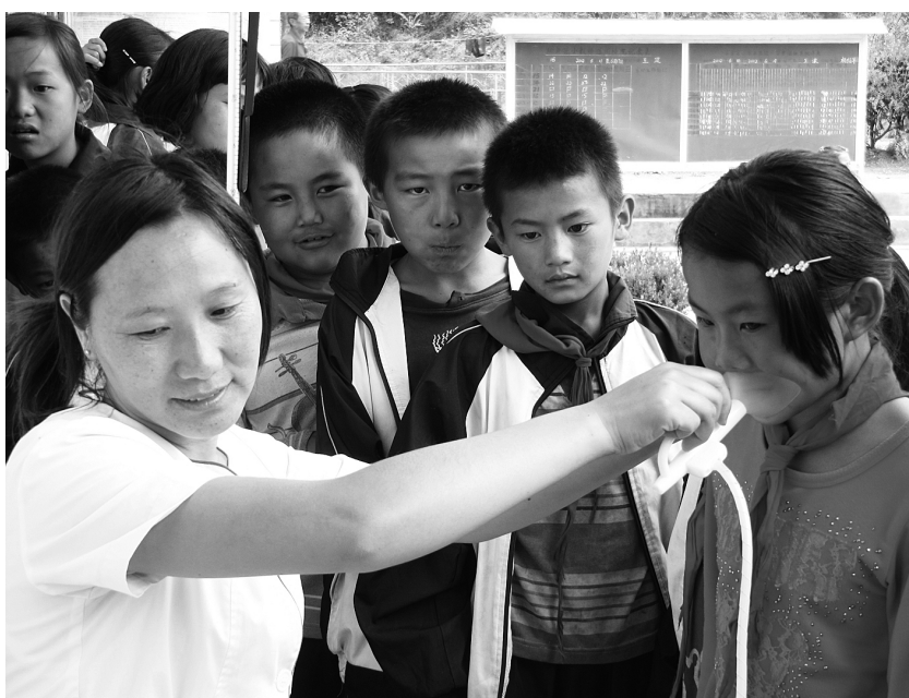
医务人员到云龙检槽村完小为学生测定肺活量。为确保各中小学校正常的教学工作和学生的身体健康,近日,云龙县检槽医院派出4位骨干医务人员深入全乡九所小学和检槽中学开展学校预防性健康体检工作。检查项目有身高、体重、胸围、肺活量、视力、沙眼、牙齿。