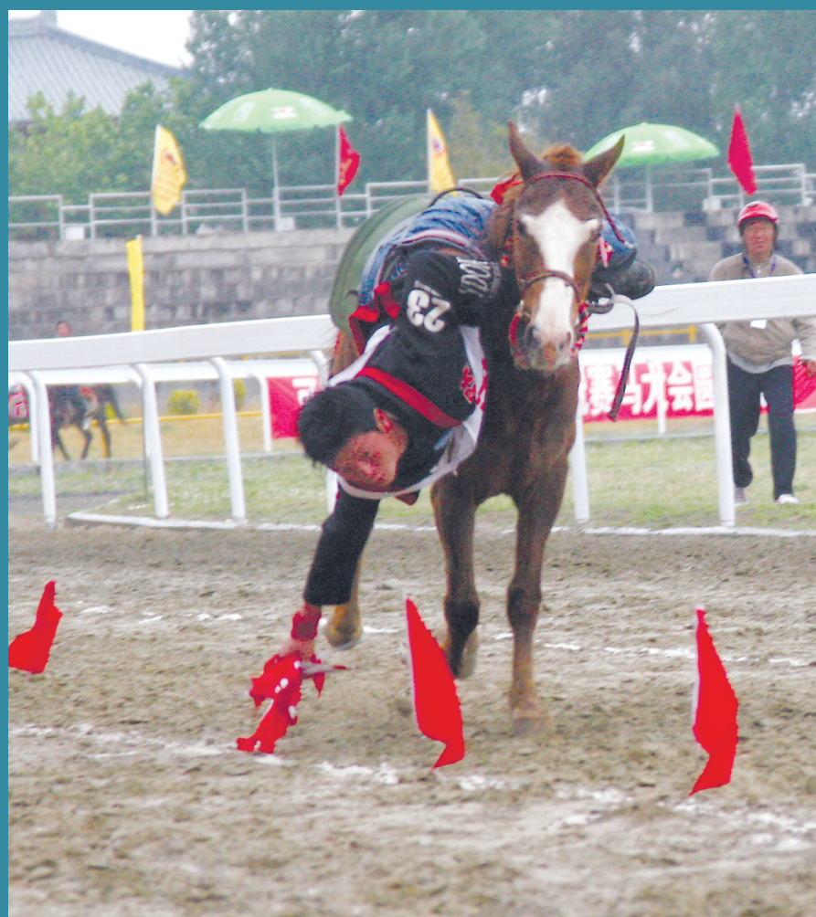
近几年,赛马场上又增加了新的项目