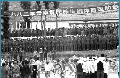
1982年,三月街赛马场的主席台