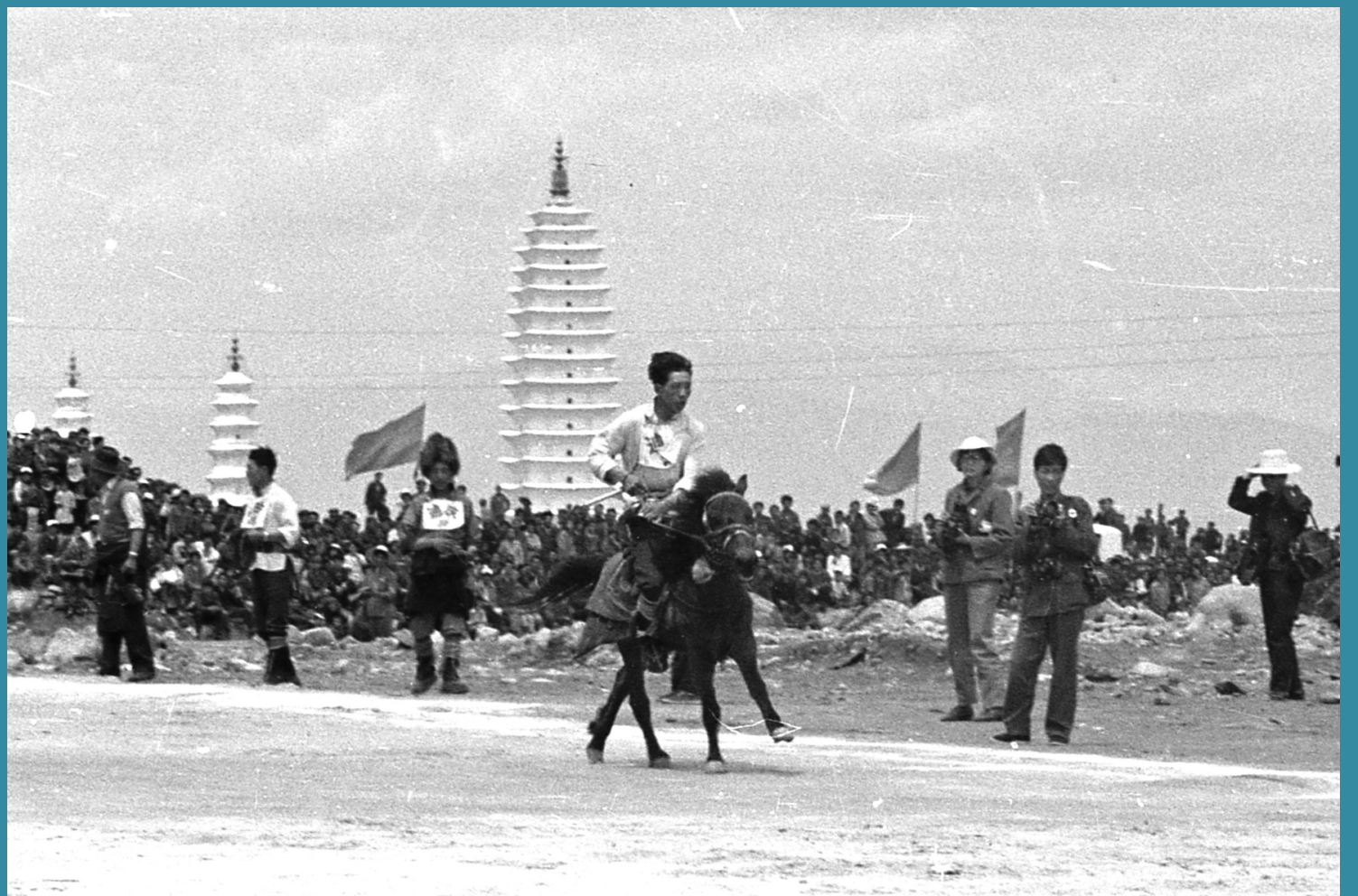
1982年,中旬的小伙子来三月街赛马