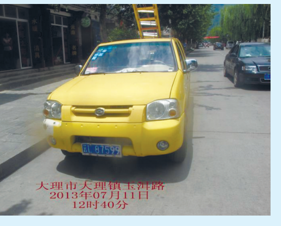
大理市大理镇玉洱路 2013年07月11日 12时40分