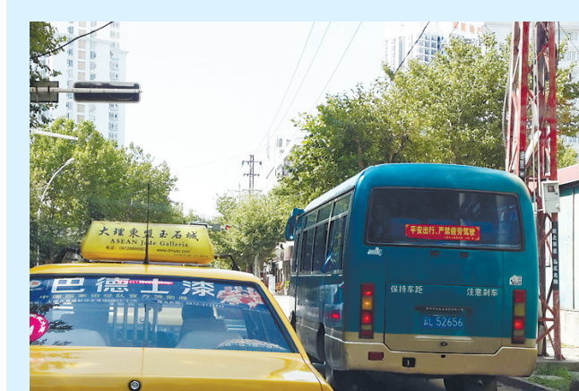
►图中这辆中巴车在等红灯时占用右转弯车道,造成后面车辆无法右转弯。绿灯亮时,该车又强行左转弯直行车辆。