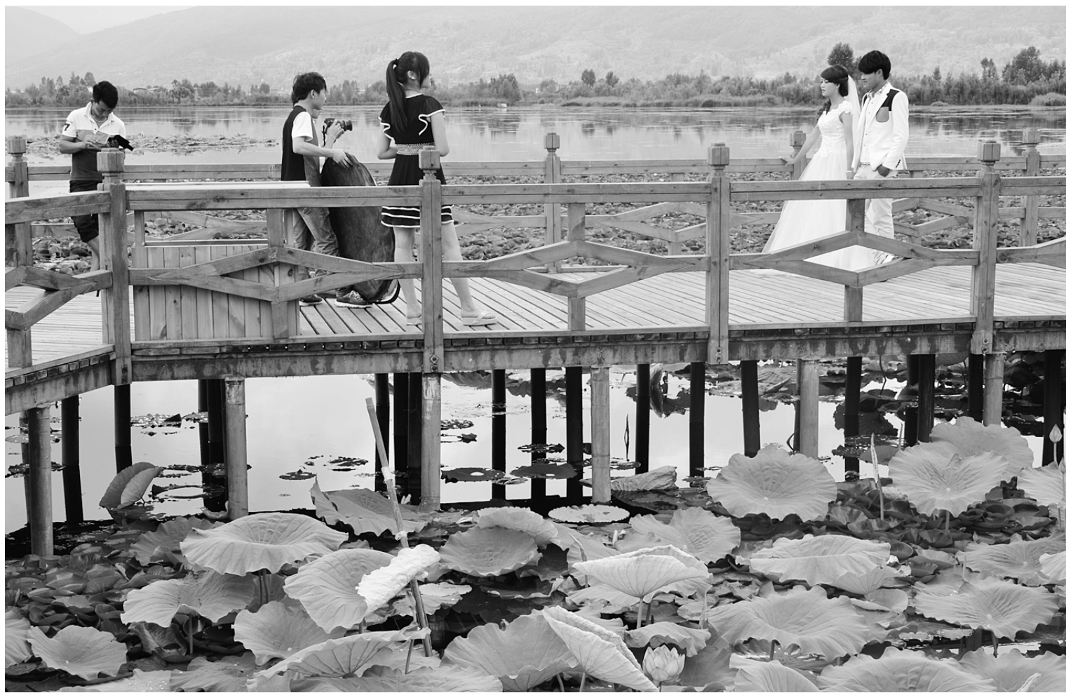
洱源湿地:婚纱摄影热门取景点

洱源县茈碧湖镇草海自然湿地,一对新人在拍摄外景婚纱照。在推进全国生态文明试点县建设进程中,洱源县以湿地建设为重要抓手,与旅游综合开发相结合,在充分发挥湿地生态功能的同时,注重湿地的人文功能开发,大力推动湿地园林化建设,湿地成为提升洱源旅游品位的重要载体。目前,规划建设万亩湿地已建成7000多亩。