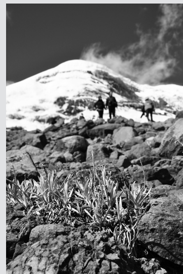
这是6月29日在厄瓜多尔拍摄的钦博拉索雪山上的兔耳草。据当地向导介绍,当地印第安妇女分娩后,用兔耳草和其他11种草药煮水饮用并泡脚,有助于迅速排出恶露,恢复身体,四个月后可以再次怀孕。

当日,连续降雨使得地处贵州省安顺市的黄果树大瀑布进入丰水期。据了解,目前瀑布每分钟流量达3600立方米,丰沛的水量让瀑布显得格外壮丽、气势非凡。