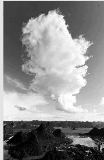
云南丘北普者黑风光(6月28日摄)。

云南省文山壮族苗族自治州丘北县普者黑总面积388平方公里,属于滇东南岩溶区,以“水上田园、湖泊峰林、彝家水乡、岩溶湿地、荷花世界、候鸟天堂”六大景观而著称。每年夏天,万亩盛开的荷花吸引众多游客前来水乡荡舟休闲,观赏美景。