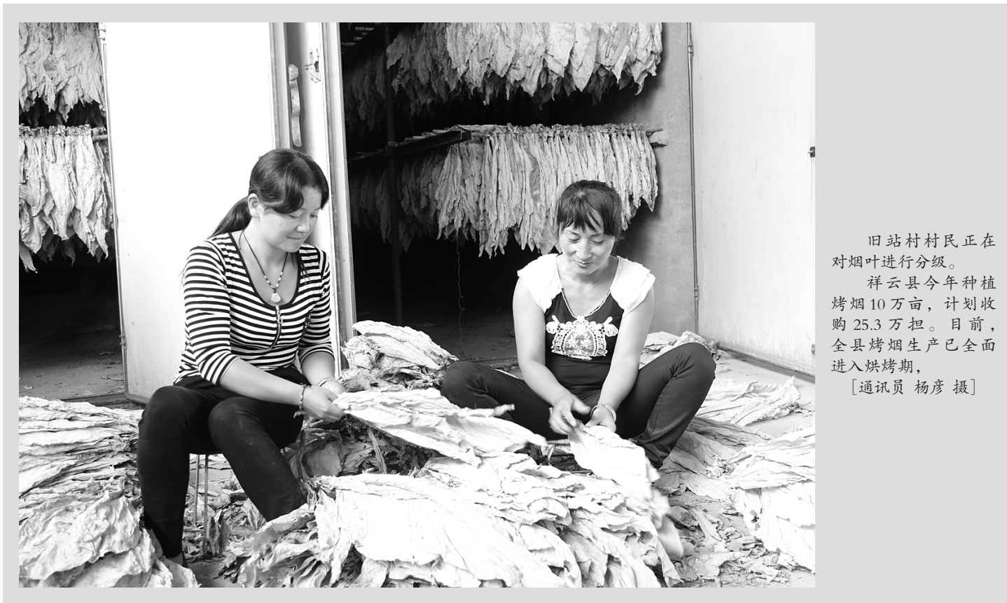
旧站村村民正在对烟叶进行分级。 祥云县今年种植烤烟10万亩,计划收购25.3万担。目前,全县烤烟生产已全面进入烘烤期。

经历过抗震救灾工作的三营镇村干部深知,危难时刻,更显人间真情;积少成多,细流可成江河。在镇党委、政府主要领导的带领下,大家纷纷慷慨解囊,为地震灾区献出自己的爱心,以实际行动为灾区群众贡献绵薄之力。本次活动,130多名镇村干部共募捐爱心捐款18701元,已全部移交县红十字会转交灾区人民。