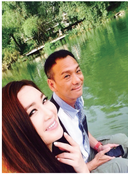
近日,不老女神温碧霞和老公何祖光一起到桂林游山玩水,夫妻俩十分恩爱。48岁的温碧霞保养有方,仍然甜美娇俏。

乒超女团决赛将于10日进行,对阵双方是卫冕冠军八一冀中能队与上届亚军山东鲁能队。