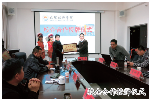
校企合作授牌仪式