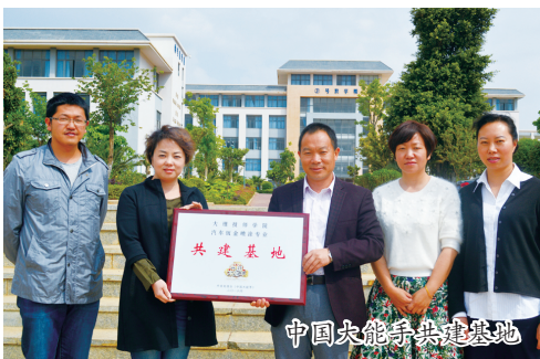
中国技能大师培训基地