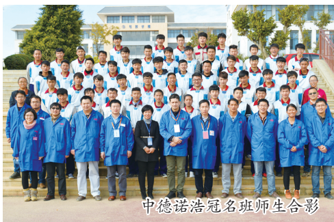
中德诺浩冠名班师生合影