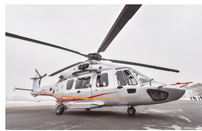
这是12月20日拍摄的AC352型直升机。

佩斯科夫还表示,普京已与土耳其总统埃尔多安就这一事件通电话,双方商定彼此加强对俄土外交人员的保护,俄方将向安卡拉派出一个调查小组参与侦破枪杀俄大使一案。