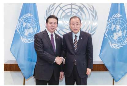
12月19日,在位于美国纽约的联合国总部,联合国秘书长潘基文(右)会见国际刑警组织主席孟宏伟。

上任刚刚1个月的国际刑警组织主席孟宏伟19日到访联合国,并与联合国秘书长潘基文在纽约联合国总部举行会见。