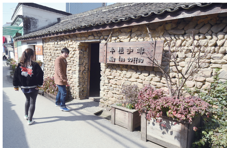
1月22日，游客光顾杭州市桐庐县江南镇荻浦村的“牛栏咖啡馆”。该咖啡馆是由当地村庄的一处牛栏改造而成的。在春节即将到来之际，浙江桐庐县各地的民宿已开始一床难求。以“美丽经济”著称的浙江省桐庐县将青山、绿水、古村等“沉睡资源”转化为“发展资本”，通过将古村落的整理改造，让原本闲置破落的民居重新焕发了生机，成为了农民就业增收的新途径。