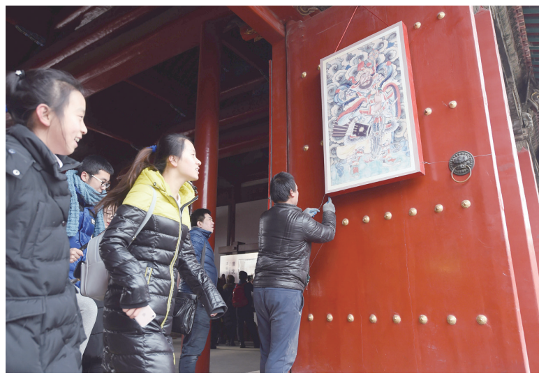
1月19日，工作人员在沈阳故宫悬挂“门神”。当日，沈阳故宫博物院举行灯笼门神悬挂、对联年画展览、开放新的展览区“敬典阁”等活动，迎接农历春节到来。春节假期，沈阳故宫还将陆续增加非遗文化展示、“幸运大转盘”、文化演出“皇宫过大年”等活动。