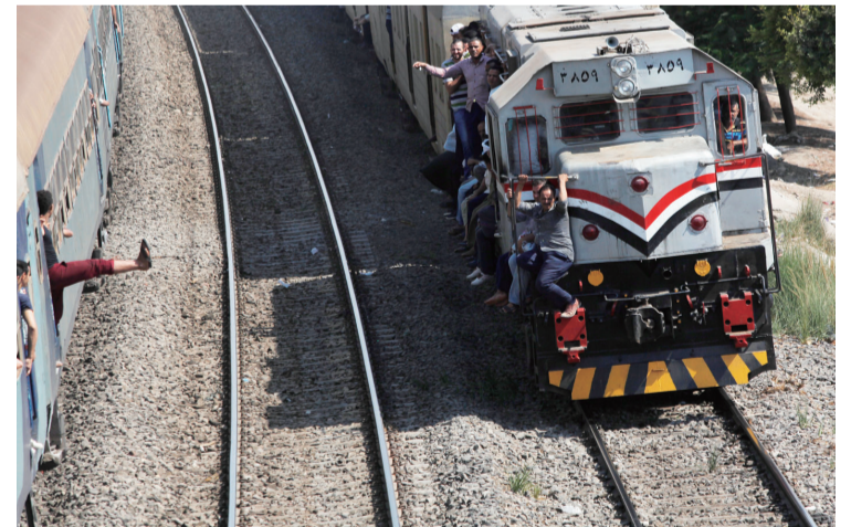
8月13日,埃及首都开罗,当地人乘坐超载的火车。埃及运输协会主席穆罕默德·谢哈塔13日表示,中国拥有全球领先的铁路产业,也有帮助非洲国家修建铁路的经验,中国可以帮助埃及升级铁路基础设施。

意见强调,要保障电力安全供应。参照钢铁煤炭行业去产能工作的职工安置政策,对符合条件职工实行内部退养,维护职工合法权益;挖掘企业内部潜力,优先在发电企业集团内部安置解决分流职工;地方人民政府要指导督促企业制定并落实职工安置方案,依法依规妥善处理经济补偿、社会保险等问题,维护社会大局稳定。