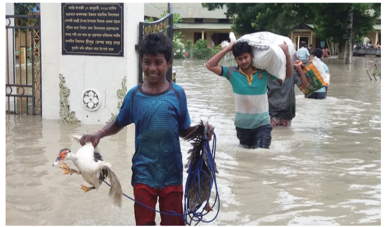
8月13日,在印度东北部阿萨姆邦,人们在洪水中前行。据印度媒体14日报道,近期印度阿萨姆邦洪灾肆虐,死亡人数已升至99人。