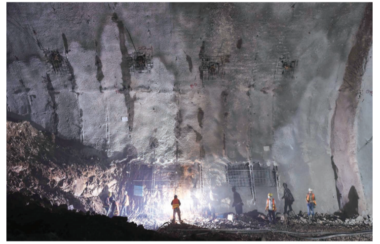
工作人员在京张高铁长城站内进行施工(8月8日摄)。目前,在北京八达岭长城核心区,京张高铁长城站正在崛起。高铁站总长470米,地下建筑面积3.6万平方米,轨面位于地下102米处,不仅是北京2022年冬奥会的重要交通设施之一,也是京包兰快速客运通道的重要组成部分。