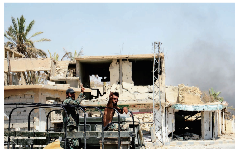
8月13日,在叙利亚霍姆斯省的苏赫奈,士兵摆出胜利手势。叙政府军近日夺取极端组织“伊斯兰国”在中部霍姆斯省的最后重要据点苏赫奈市。

美国外交学会资深研究员爱德华·奥尔登对新华社记者说,相关各方有必要重启多边贸易谈判并作出妥协,“遏制保护主义的唯一途径是通过国际谈判来解决各方关切”。