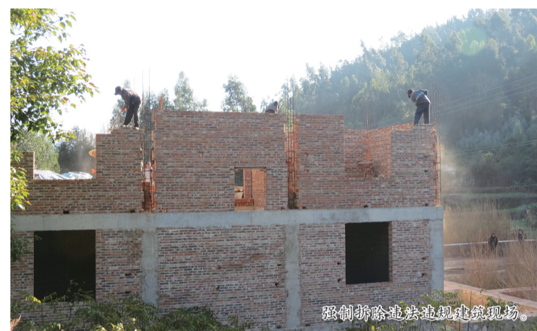
强制拆除违法违规建筑现场。

本报讯(通讯员 赵思兰文/图) 在全面推进洱海保护治理“七大行动”中，大理市凤仪镇强化措施，稳步推进“两违”整治行动，铁腕整治违章建筑。11月29日，凤仪镇依法对17户违法、违规建筑进行拆除，规范农村住房建设秩序，整治未批先建、违规乱建等违法行为。