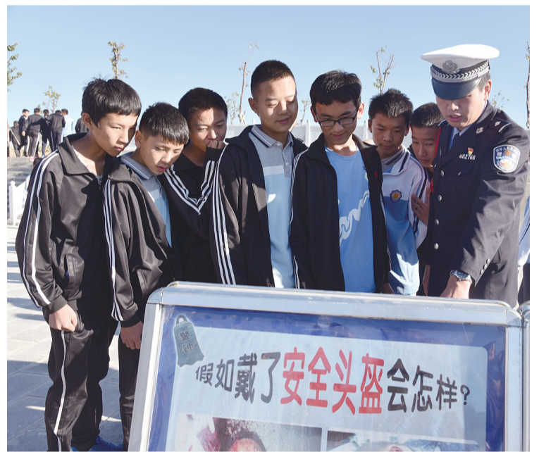
这是交警在交通宣传展板前向学生讲授交通安全知识。

近日，宾川县公安局向派出所交警中队联合向中学集中开展了交通安全警示教育“校园三开展”活动。交警以案例向广大师生、学生家长讲解酒驾、不戴安全头盔驾乘二轮摩托车、多人乘骑、无牌无证、超员超速以及乘坐低速载货汽车等交通违法行为的严重危害和后果。倡议大家遵守交通法规，平安出行。